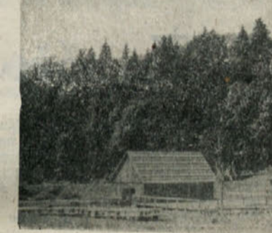
Jelenov žleb en dan pred proslavo

Na velikem prostoru v Jelenovemu žlebu se je zbrala vsa množica ljudi, prav gotovo jih je bilo nad 6000, na partizanski rajanje. Nam vsem bo proslava v Jelenovemu žlebu ostala v neizbrisnem spominu.