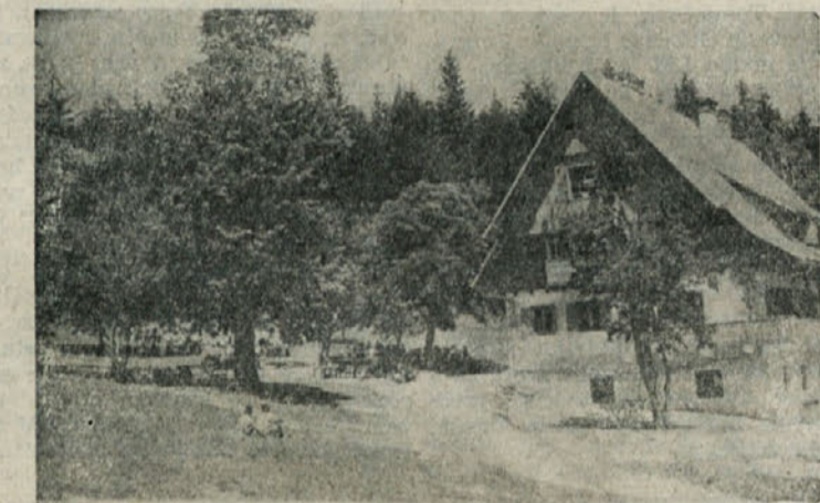
Oh Domu na Travnj gori