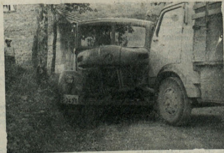
Zaradi slabih zavor se je avto, ki vozi mleko iz Koprivnjaka zaletel v nasprotni avto. Ta avto res ni sposoben za prevoz potnikov!