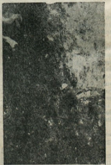
Prvi jamar se spušta v Brezno pri Jelenovem žlebu

Nazadnje so brezno narisali in označili, najdeni material pa bodo verjetno poslali v muzej.