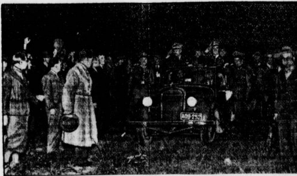
Na Poljskem so nabrali okrog 70.000 prostovoljcev, da bi se bojevali za tešinsko ozemlje. Slika nam kaže prihod voditeljev prostovoljcev v Sieszyń