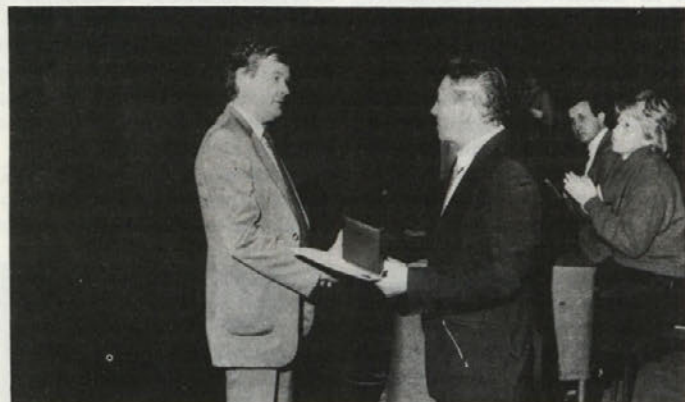
Predstavniki Cinkarne prejema veliko zlato plaketo Plastex '86 s poveljem.

Center RAST-YU pa ni samo razstavni prostor, kjer si mnogo obiskovalcev iz Jugoslavije in tujine ogleda nove dosežke, temveč je mesto medsebojnih izmenjav, informiranja, spoznavanja dosežkov iz večjih delovnih or-