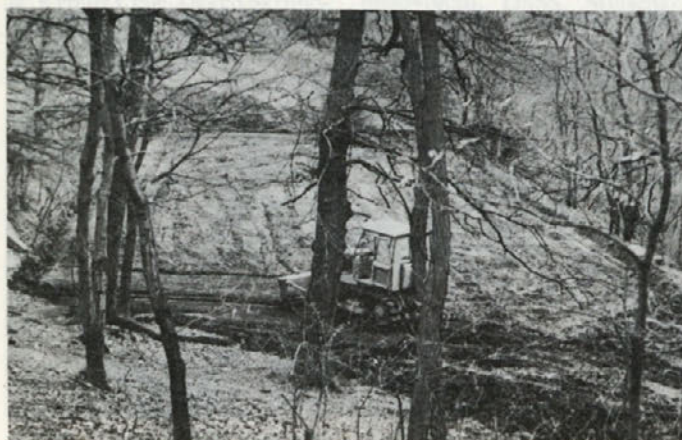
Tenis sekcija z udarniškim delom pripravlja novo igrišče nad Toprom