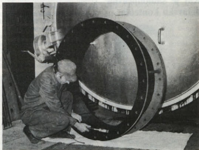
Izdelava kompenzatorja v Veflonu

tudi inštitutov. Transfer tehnologije se povečuje iz leta v leto, kar pomeni, da tudi domače znanje pridobiva na veljavi. Skoraj na vsakem našem razstavljenem eksponatu je bilo napisano ZAMENJUJE UVOZ. Vse to dokazuje, da so in postajajo inovacije sestavni del po-