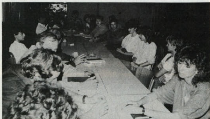
Sestanek koordinacijske konference ZSMS, kjer so opravili volitve za predsednika predsedstva.

Mladi pripravljajo že tudi program dela za letošnje leto, čeravno to še ni tisto, kar mislijo načrtovati naslednje leto. Najprej morajo sprejeti statut KK, osnutek še pripravljajo. V jeseni bodo organizirali nekaj očiščevalnih akcij v DO, strokovno