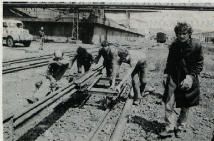
Posnetek z delovne akcije očiščenja okolja mladine v Tozdu transport in skladišča

oživiti delo do konca leta tako, da bo aktivnih najmanj sto mladih, bodo za naslednje leto napravili pravi program, katerega rezultate lahko pričakujemo od marca 1987 dalje.