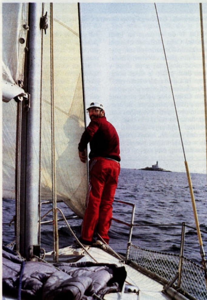
Želimo vam, da preživite lep, prijeten dopust

ravnalo Povzetek dolgoročnega načrta Cinkarne Celje in (nadaljevanje na 2.strani)