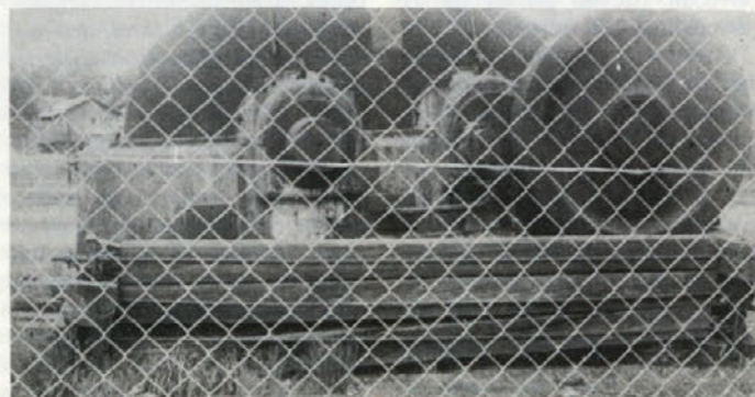
Reduktor stare valjarne stoji zdaj na ozemlju, ki ga je Cinkarna odprodala EMU. Njegova usoda je sedaj še bolj neznana.