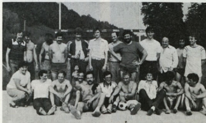
V dvoboju PTFE in PEAM tozda Veflon so zmagali delavci iz obrata PTFE