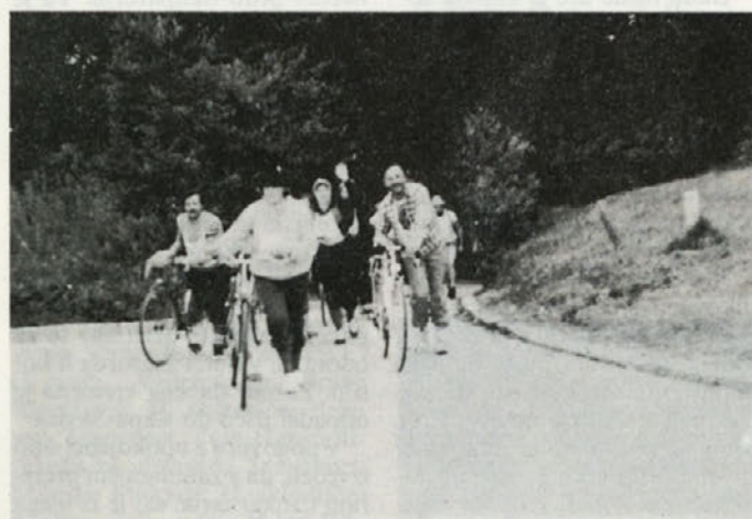
Skupina prihaja v cilj, v ospredju naši planinci