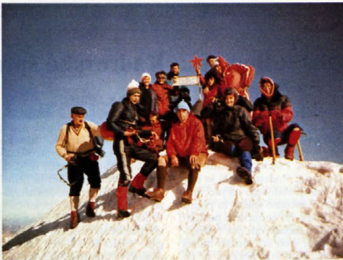
Za Dan mladosti na Triglavu

v višino, se razdelimo v dve skupini. Ena gre po položnejši poti, drugi pa krenemo po plazju navzgor. S cepini si pomagamo preko zbitega snega in kmalu smo par sto metrov višje. Če se ozreš nazaj, imaš občutek, da stojiš na vrhu velike skakalnice.