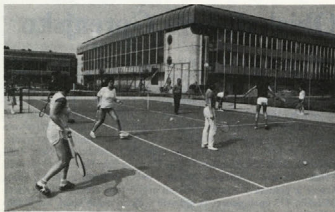
Spomladanskega tečaja tenisa se je udeležilo 15 talentov