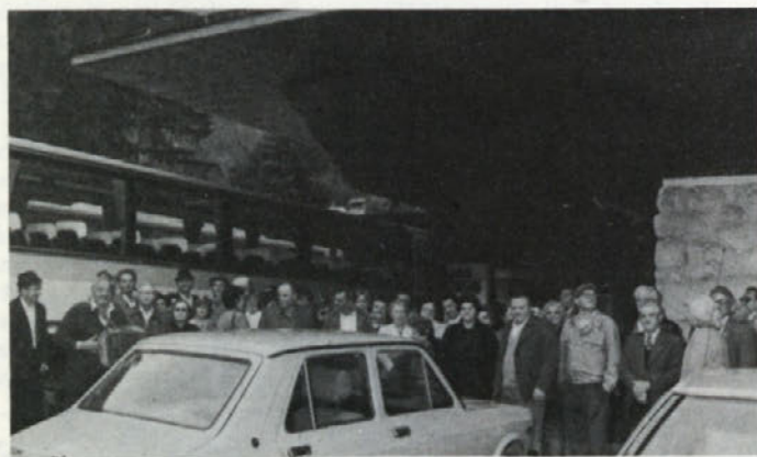
Pred hotelom Zlatorog v Bohinju. Ker se je pripravljalo na dež so nekateri stopili pod streho

Zaradi tako velikega števila prijavljenih, sta bila izleta načrtovana za četrty in peti junij, torej v mesecu, ko naj bi bilo resnično lepo vreme. Narava jih je izdala in jih prvi dan obdarila z obilnim deževjem. Tudi naslednje jutro ni kazalo dosti bolje. Ko so se zbirali po sedmi uri pred Vrtnico, so z nezaupanjem gledali v nebo, prekrito z oblaki, skozi katere je pokukavalo sonce. Zaradi negotovega vremena se je izleta udeležilo 473 upokojencev in njihovih svojcev, nekaj manj, kot je bilo prijavljenih.