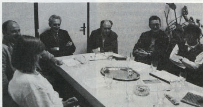
Predstavniki Gozdnega gospodarstva Celje tretji dan na obisku v CC

Ko sem prišla v krajevno skupnost, se sestanek še ni pričel. Z znanimi obrazi iz Cinkarne in drugod sem se pogovarjala in slišala veliko kritik na račun onesnaževanja Cinkarne, češ da onesnažen zrak uničuje solato, drevje in druge vrtno pridelke. Občani zato menijo, da bi morali imeti največji delež pri odločitvi za razvojni program Cinkarne.