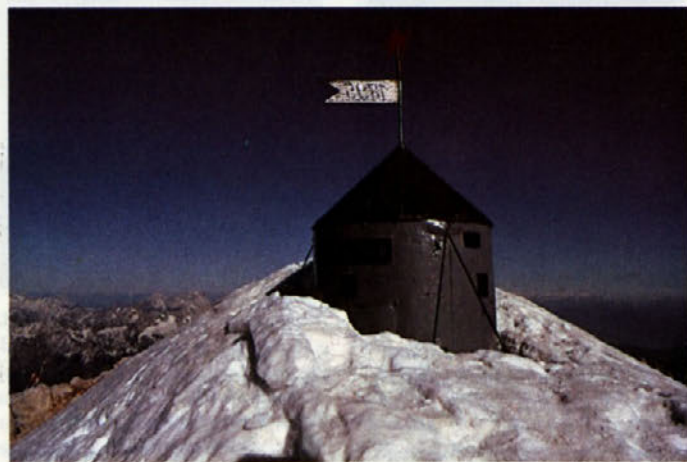
Pomlad na najvišjem vrhu naše dežele