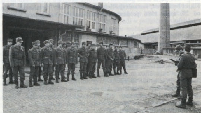
V letošnjem letu smo ustanovili vod teritorialne enote Cinkarne