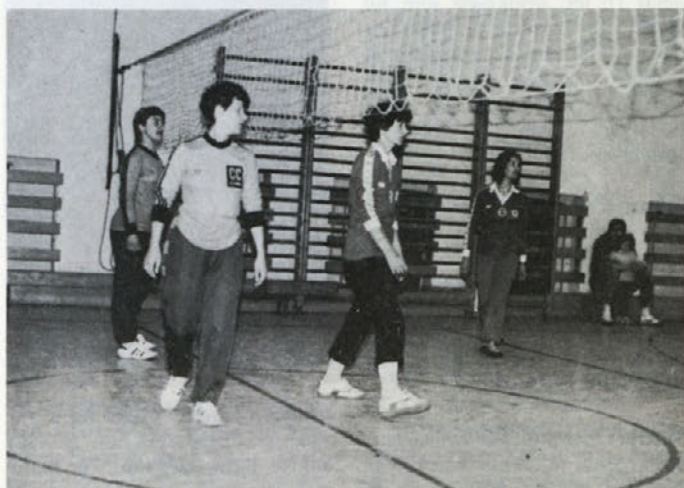
Naše odbojkarice so prepričljivo premagale nasprotnice iz Železarne.