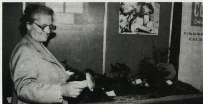
Gobsarska družina Celje je pod pokroviteljstvom Cinkarne nastopala tudi na spomladanskem obrtnem sejmu v Golovcu.