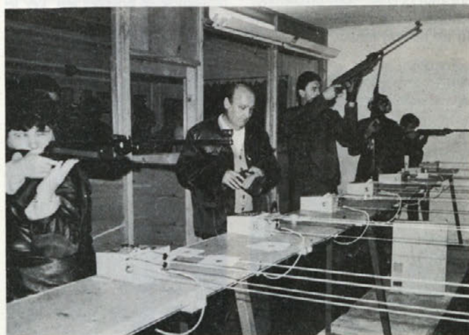
Naši in železarniški strelci v Štorah