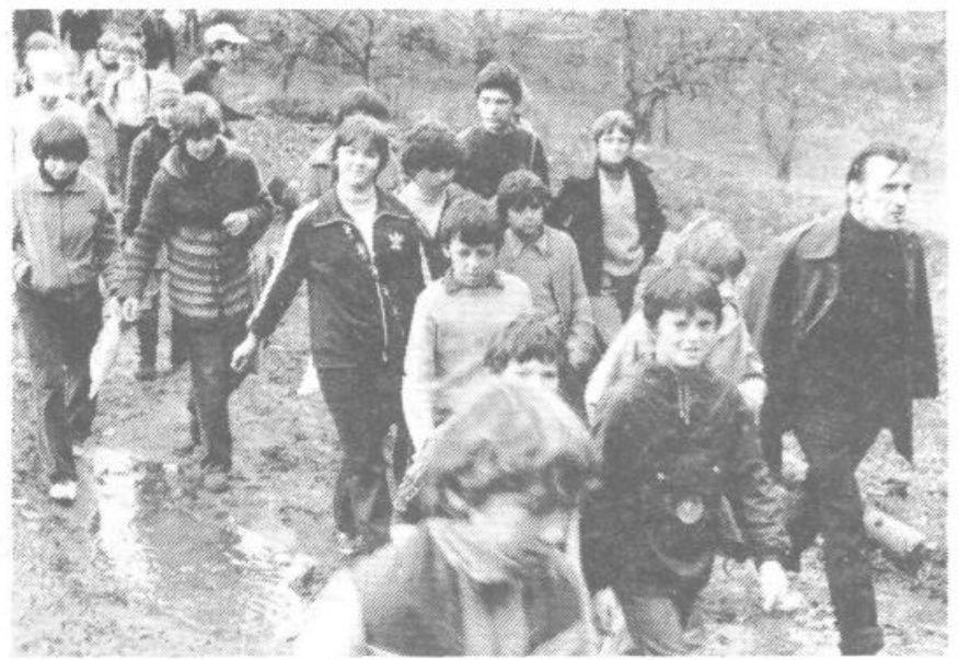
Trimski pohod na Igu privabi mlajše in starejše ljubitelje hoje

2. Starejši pionirji (rojeni 1966) in starejše pio-