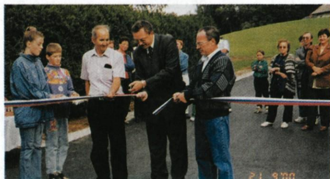
Prijetno srečanje so ob otvoritvi pripravili v Podstrani, kjer so po dolgih letih dobili asfaltno povezavo tako do Moravč, kot tudi do Krašč.

Novo asfaltno prevleko so dočakali zaselki v Češnjicah pri Moravčah, kjer je bilo položenega okoli 1,5 km asfalta, za okoli pol km je manj makadama na cesti proti Limbarski gori, kjer je cesta poasfaltirana do Hrastnika, prvih nekaj sto metrov asfalta so dobili v Križatah, v Spodnji Dobravi, Cesti na Grmače