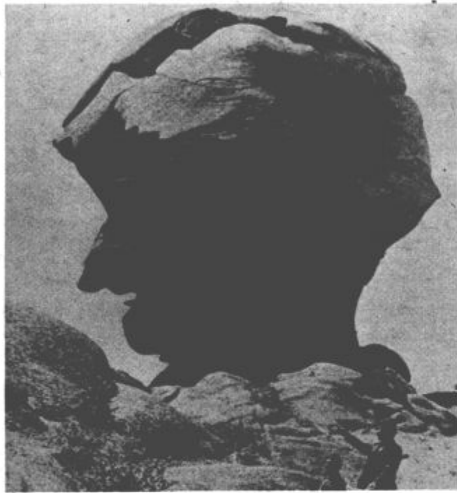
ČUDO NARAVE – Na vseh koncih sveta lahko srečamo zanimive igre narave, za katere bi težko rekli, da so nastale slučajno in niso delo človeške roke. Stena, ki so je pred kratkim odkrili sovjetski planinci v bližini Pavlodara, je ena od uspešnih kiparskih del matere narave. Stena „Starec“ spominja na nekega brez zobega starca. Vendar njene velikanke mere opominjajo, da to ni delo kiparja. Na sliki: Na kaj vas spominja ta stena?