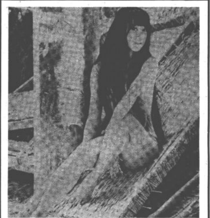
Exgotična lepota Mej-Cen je pričela svojo filmsko kariero z 18 leti v Veliki Britaniji. Nastopila je v dveh filmih poleg Stanleyja Bakerja. Mej - Cen bo kmalu začela snemati televizijsko serijo o ženski - Tarzanu, v džunglah Bornea.