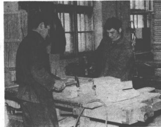
Zaposleni v Tovarni oblazinjene pahištva „Nova oprema“ v Slovenj Gradcu so sprejeli v zadnjem času pomembni odločitvi – posodobili in povečali bodo proizvodnjo, z novim letom 1975 pa se bodo vključili v „Gozdarstvo in lesno industrijo Slovenj Gradec“, saj želijo zagotoviti še hitrejši prihodnji razvoj njihove delovne organizacije

sklad otroškega varstva. Z zgraditvijo novih vrtcev na Legnu ter v Podgorju bodo v Mislinjski dolini rešili največje probleme na področju vzgoje in varstva predšolskih otrok. Največja prihodnja naložba bo ali obnova prostorov ali pa postavitve novega vrtca v Smartnem pri Slovenj Gradcu. Ob intenzivnejši izgradnji nove stanovanjske soseske ob Celjski cesti v Slovenj Gradcu pa bo treba zagotoviti organizirano varstvo in vzgojo še za otroke iz te soseske.