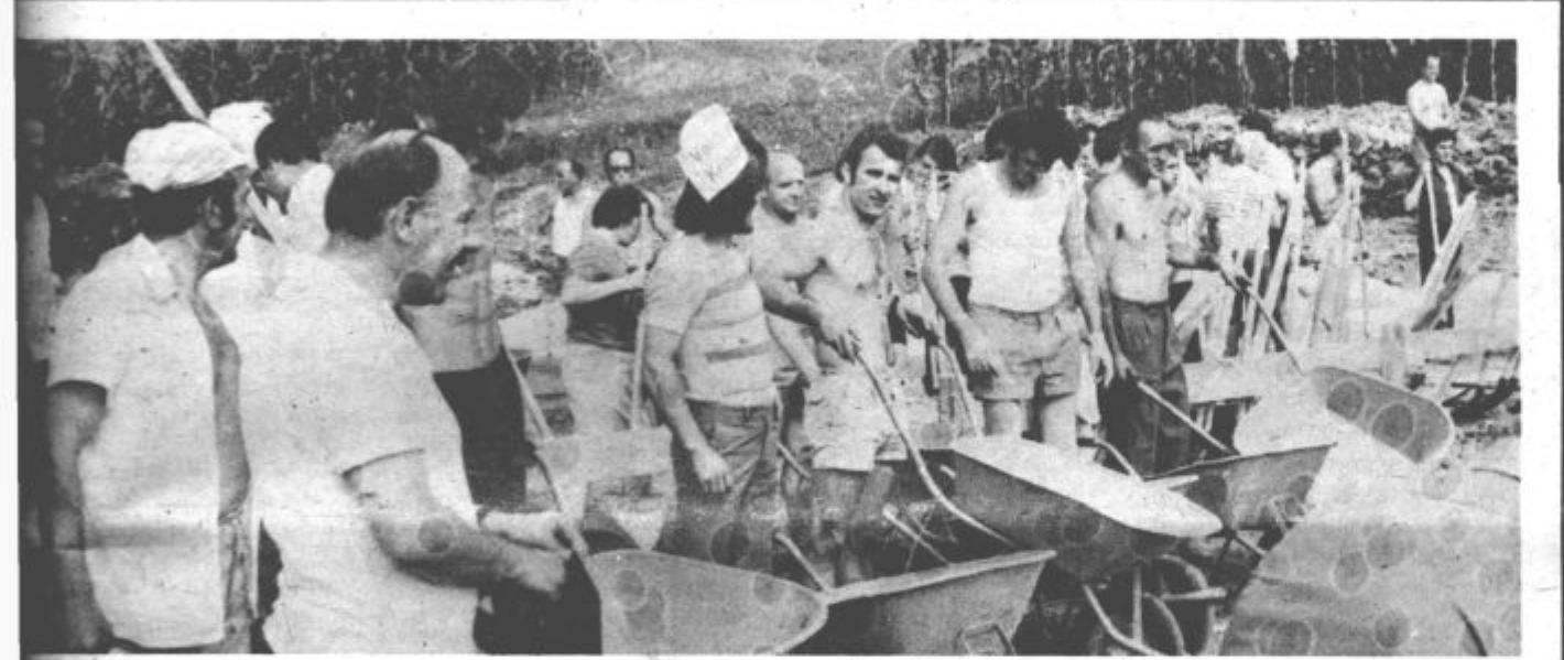
Prve udarniške sobote v Zibiki se je udeležilo blizu dvesto prostovoljcev iz Velenja.

naš čas avgust 1974 leto X št. 30 (238) cena 2 din Glavni in odgovorni urednik Ljuban Naraks