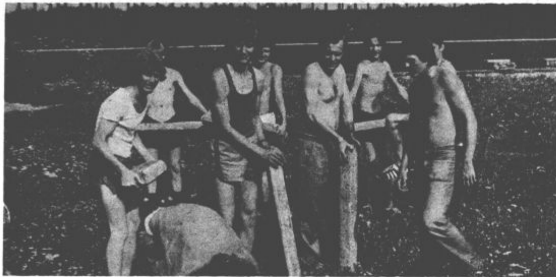
Velenjski atleti so se lotili prvih udamiških del na stadionu.

Ponedeljek 12. 8. ob 20 uri italijanski barvni vestern ZIVELA TVOJA SMRT