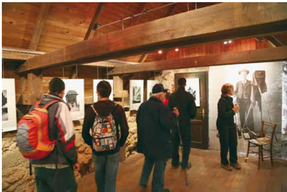
Utrinek z razstave Družinsko romanje na Šmarno goro, Fotopis Petra Nagliča iz leta 1933

MAGIJA EGIPTA (22. november 2014–18. januar 2015, Museum Archeologico Siracusa) (10. Oktober–10. november 2014, Regional Museum Agostino Pepoli, Trapani)