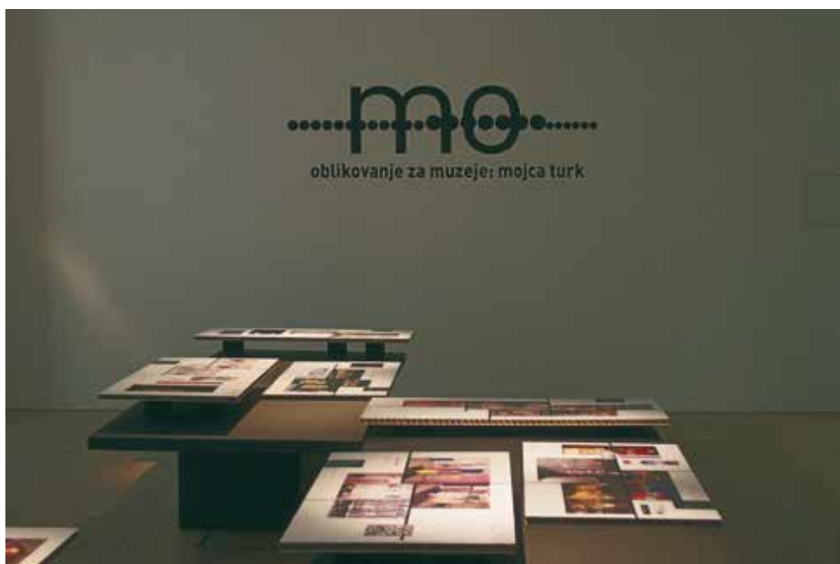
Utrinek z razstave Oblikovanje za muzeje: Mojca Turk

(Avtorica razstave in oblikovanje: Mojca Turk; kustodinja in koordinatorka razstave: Nina Zdravič Polič; oblikovanje svetlobe: Marjan Visković; fotografije: Blaž Zupančič, Sarah Bervar, Sašo Kovačič, Miha Špiček, Aleš Žgajnar, Nada Žgank; komuniciranje: Maja Kostric, Domen Uršič; tehnična podpora: Domen Uršič, Aleš Žgajnar)