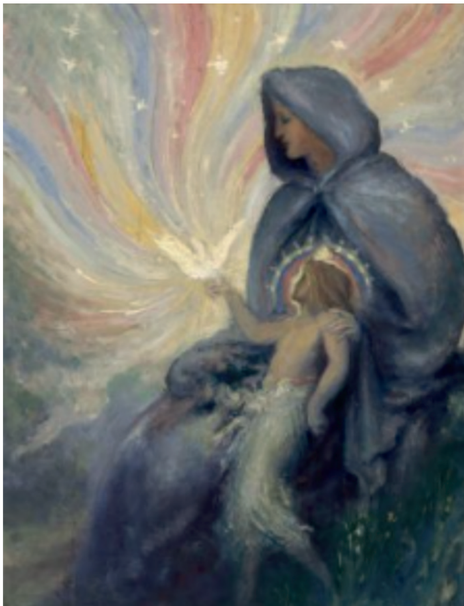
Devica in otrok - AE