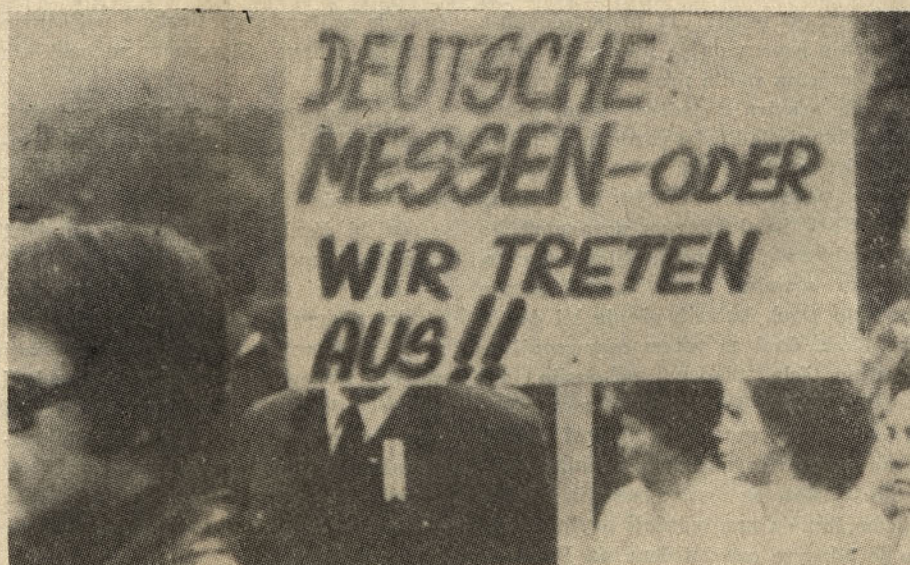
„NEMSKA MAŠA — ali pa mi izstopimo.“ Tako piše na plakatu med protislovensko manifestacijo v Celovcu. Neštrpnost je povsod, tudi v cerkvi.