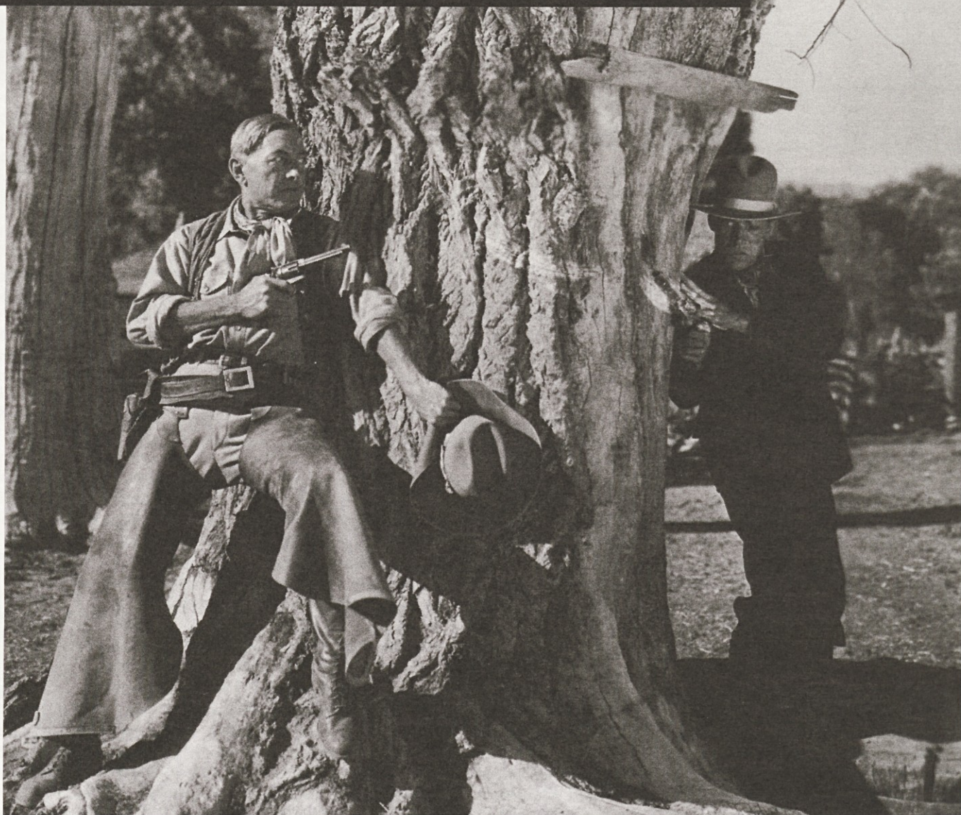
The Vanishing Legion

Če hočete vedeti, kaj je to B ali pa Z vestern, si zarolajte film Guilty by Suspicion , ki ga je leta 1991 posnel Irwin Winkler. Robert De Niro igra h'woodskega režiserja, ki v času makartističnih zasliševanj in čistk noče ovaditi svojih komunističnih prijateljev, zato ga njegov matični studio flikne na črno listo. Ker se znajde na cesti, Annette Bening pa je lačna, gre s trebuhom za kruhom, kar ga pripelje naravnost v h'woodski trebuh, na Poverty Row. In tako stopi k šefu male ubožne Z firme, rekoč: Imate kaj dela zame? Šur, dahne šef, ki je pravkar nagnal režiserja in ki De Nira takoj zatem pošlje v akcijo, na ulico, kjer se že snema B, okej, Z vestern – De Niro, ki pade in medias res , vpraša le, okej, kje smo, v naslednjem trenutku pa že režira. Kamera?! Gremo! Akcija! De Niro nima pojma, za kaj gre v tem vesternu (ni prebral scenarija niti ne ve, kaj so do tedaj že posneli), toda delo prejšnjega režiserja nadaljuje povsem mirno in insidersko . Kot da ne more zgrešiti. Kar je v nekem smislu res: B vesterni so izgledali