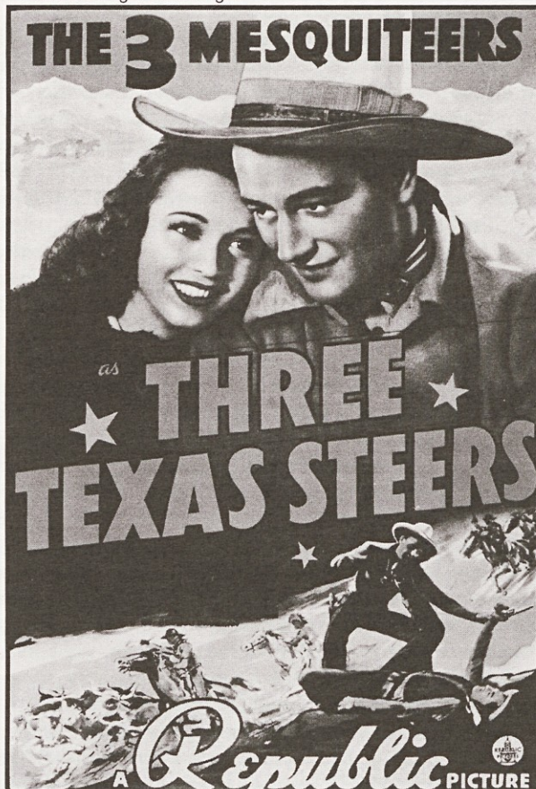
Plakat za film Three Texas Steers