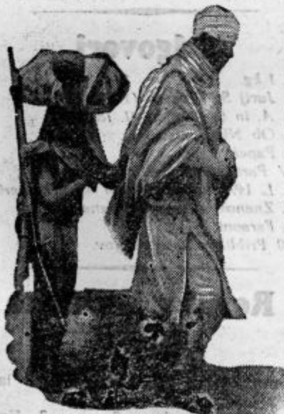
Mlad Abesinec spremlja očeta na vojno

značilno glavo in precej nizko, odločno postavbo. Bajje je zelo nadarjen in pri svojih podložnikih v visokih časteh; deželi vlada s pomočjo evropskih svetovalcev. Njegova prizadevanja, da bi povzdgnil izobrazbo in omiko svoje dežele so se morala doslej boriti z nemahnimi ovira-