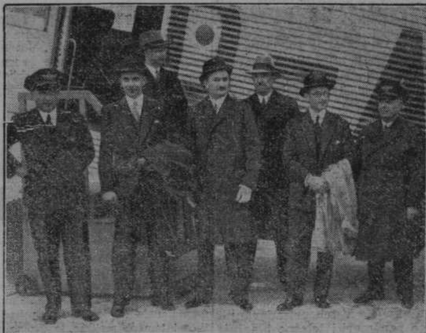
Zračni promet na progi Berlin—Varšava, ki traja 2 uri in 40 minut.