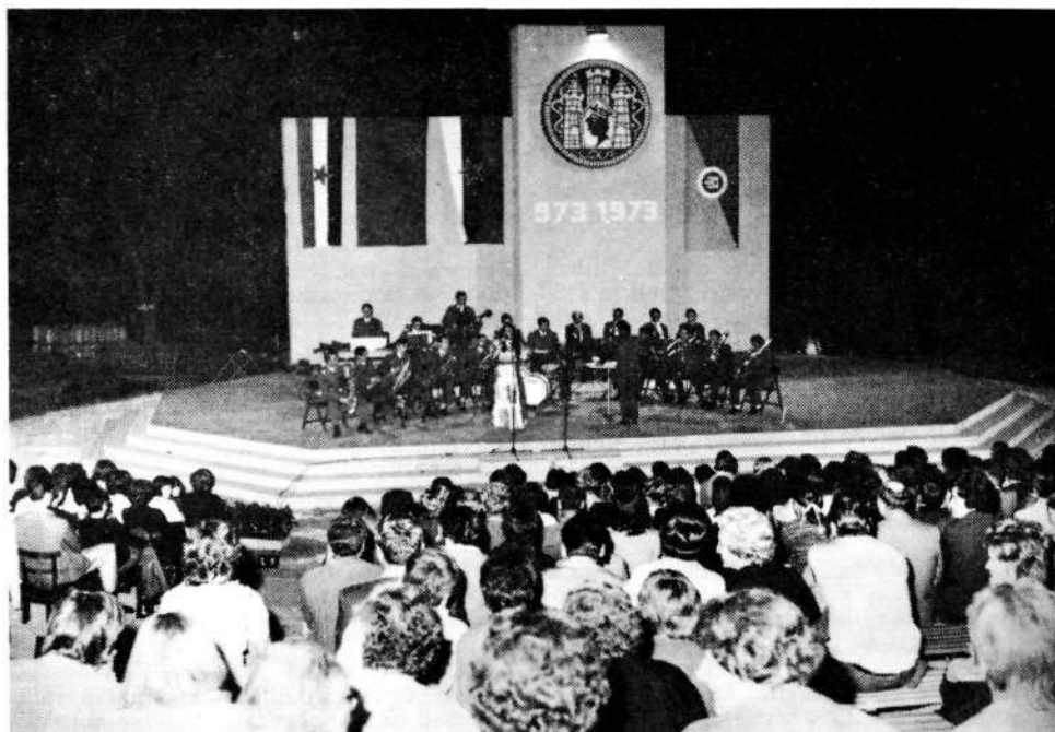
Nastop orkestra JLA v čast Dneva borcev.

rilni listini, ki sporoča, da je nemški cesar Oton II. daroval pretežni del Sorškega polja, celotno Selško dolino in vzhodni del Poljanske doline v posest freisinškemu škofu Abrahamu. V tej listini je tudi prvič omenjena Loka. Od tega dne dalje spremljamo zgodovinski, gospodarski in kulturni razvoj našega človeka, ki je na loškem ozemlju skozi 1000 let gradil sebi in svojim kasnejšim rodovom lepšo prihodnost. To življenjsko pot bomo prikazali v nocojšnji jubilejni prireditvi.« Nato je pozdravil vse prisotne goste: Sergeja Kraigherja, predsednika skupščine SRS, Lidijo Šentjunc, Borisa Ziherla in Miha Marinka, vsi člani sveta federacije, Andreja Marinca, predsednika izvršnega sveta skupščine SRS, dr. Marjana Breclja, podpredsednik zvezne skupščine in poslanca zveznega zbora, dr. Antona Vratušo, podpredsednika zveznega izvršnega sveta in delegate pobratenih občin.