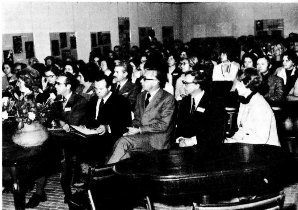
Med zborovanjem slovenskih knjižničarjev v galeriji na loškem gradu.

V času praznovanja so razne prosvetne in druge institucije organizirale v Škofji Loki za svoje člane seminarje, zborovanja, simpozije. XVI. zborovanje slovenskih zgodovinarjev je bilo že 7. oktobra 1972 in je predstavljalo uvod v praznovanje 1000-letnice. Na njem se je zbralo preko 200 udeležencev, med njimi številni znanstveniki s tega področja, predavatelji zgodovine po šolah in drugi gostje. Nanašal se je na dvoje pomembnih zgodovinskih dogodkov: 1000-letnica Škofje Loke in 500-letnica začetka kmečkih uporov na Slovenskem. Temu zborovanju so sledili še: posvetovanje za žene s prosla-