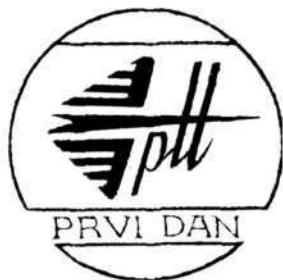
Del posebnega žiga za prvi dan veljavnosti jubilejne poštne znamke 13. II. 1974

Program praznovanja je obsegal predvsem zgraditev in obnovu objektov gospodarskega, komunalnega in spomeniško-varstvenega značaja, ki bodo ostali trajna vrednost za občane ter številne in po-