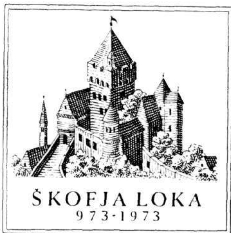
Simbol tisočletnice, upodobljen na plakatu in drugem propagandnem gradivu

To mesto s svojo širšo okolico je leta 1973 praznovalo tisočletnico svojega zgodovinsko dokumentiranega obstoja.