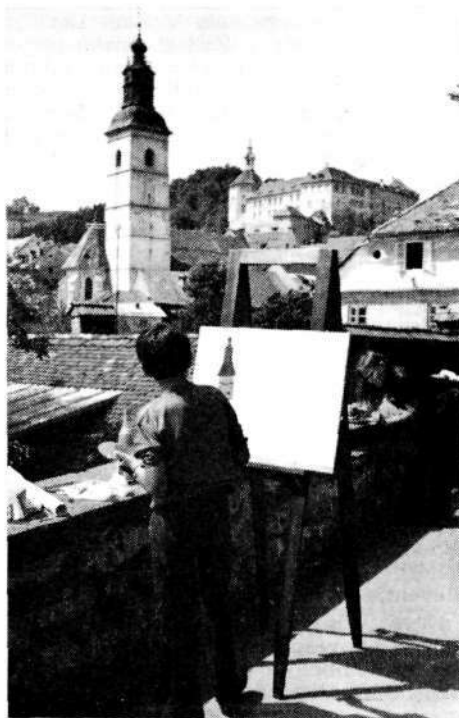
Udeleženec Male Grohajeve slikarske kolonije.

Skupina za propagando si je zelo prizadevala, da bi v letu praznovanja izšla tudi jubilejna poštna znamka. V ta namen je pripravila osnutek in informacijsko gradivo za znamko in poštni žig. Svoj predlog je nasloвила na Skupnost jugoslovanskih podjetij za PTT v Beogradu. Skupnost je predlog odobrila in 15. februarja izdala priložnostno poštno znamko in priložnostni ovitek z žigom prvega dne prodaje znamke. Kot motiv znamke je bila uporabljena gravura Škofje Loke iz 17. stoletja. Grafična realizacija je delo akademskega slikarja Andreja Milenkovića iz Beograda. Znamke v vrednosti