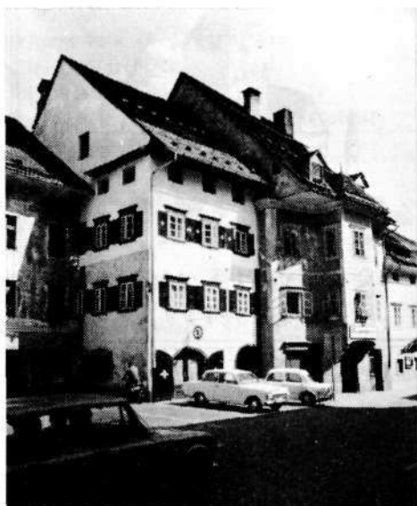
Obnovljeno pročelje Martinčkov hiše na Mestnem trgu v Škofji Loki.