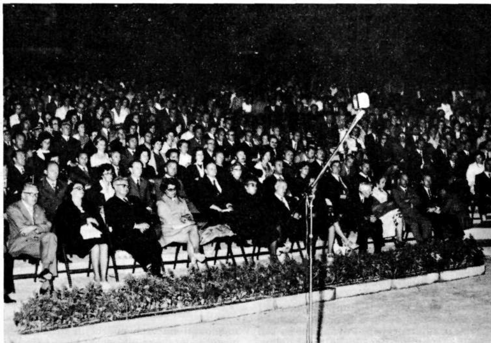
Ločani in njihovi gostje ob svečani akademiji v jubilejnim letnem gledališču na vrtu loškega gradu.