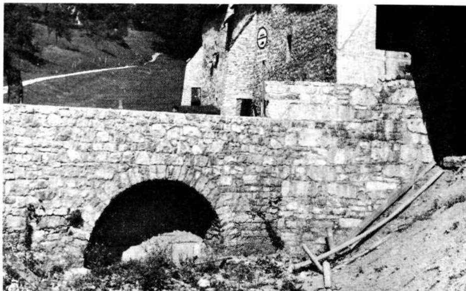
Novo odkrita škofjeloška Poljanska vrata med spomeniškovarstvenim obnavljanjem.