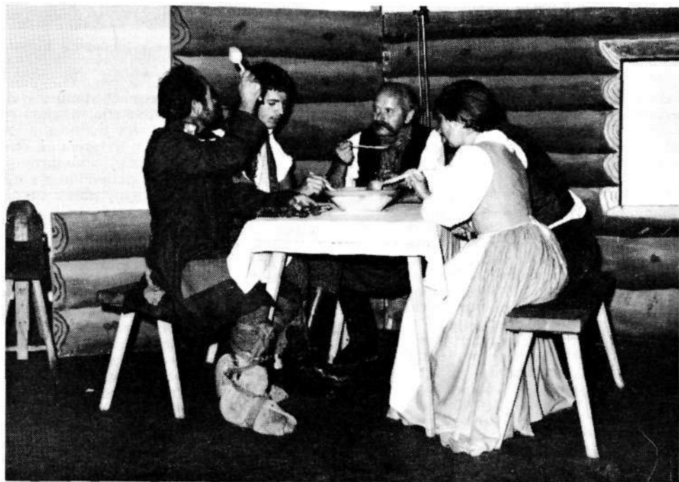
Prizor iz uprizoritve Ravbarskega cesarja, Torkarjeve dramtizacije po Tavčarjevih povestih.

Selčani so se vključili v praznovanje 8. julija z žalno komemoracijo pri spomeniku NOB v Dolenji vasi, posvečeno 30-letnici pomora 19 ujetih partizanov in aktivistov ter 1000-letnici vasi Selca. Razen predstavnikov družbeno-političnih