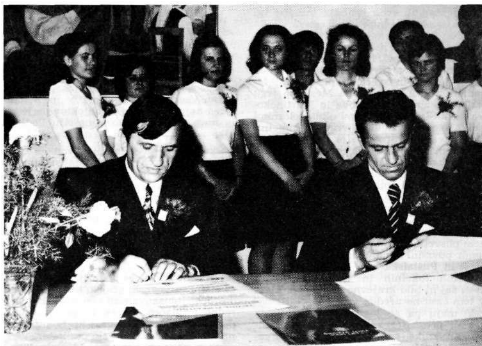
Predsednika občin Smederevska Palanka in Škofja Loka podpisujeta listino o pobratenuju.

Nepoučenemu obiskovalcu, ki je zašel v mesto — v jedro srednjeveške Loke — v letu 1972 in v prvi polovici 1973. leta, trenutna panorama gotovo ni bila posebno všeč. Naletel je lahko na razrito cesto, fasade hiš obdane s številnimi odri in na zamazane pločnike. V tem času so namreč modernizirali »drobovje mesta«, t. j. montirali so v zemljo nizkonapetostno električno omrežje, sodobno kanalizacijo