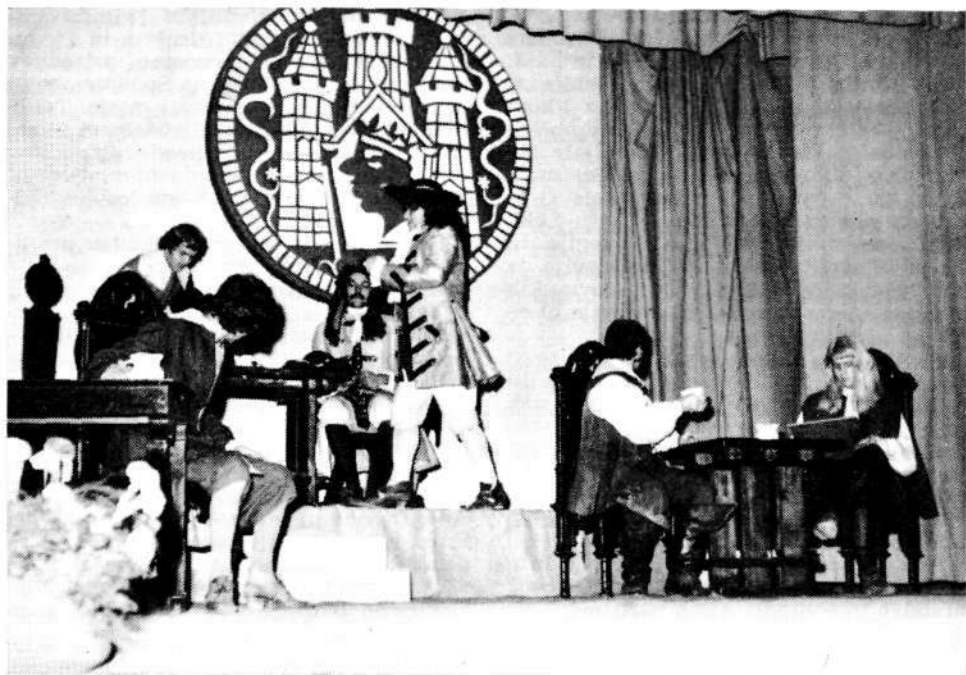
Prizor s slavnostne prireditve Škofja Loka skozi stoletja.

in vodovodne cevi. Urejali so tudi fasade hiš in lokale v družbeni lastnini. Med preurejenimi in sveže prepleskanimi fasadami starih poslopij na Mestnem trgu izstopata zlasti Homanova in Martinčkova hiša. Slednja s svojimi okni, železnimi polknicami, obokanimi vrati in umetniškimi izveskom predstavlja tipični primer domačij nekdanjih premožnih meščanskih družin. Na fasade hiš so namestili »laterne«, ki naj bi izpodrinile neonske cevi. Po opravljenih komunalnih delih so Mestni trg znova asfaltirali, kar je zelo spremenilo oziroma polepšalo podobo mesta.