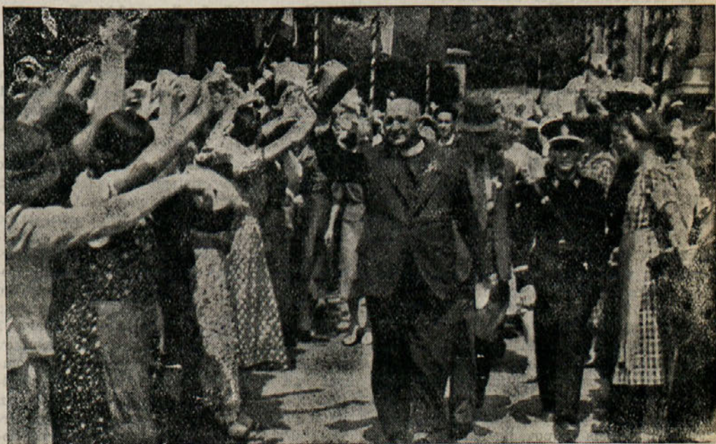
12 tisoč deklet pozdravlja voditelja Slovencev dr. Antona Korošca.

V Dobo je odbor za elektrifikacijo Doba in okolice povabil vse zainteresente na sestanek v nedeljo 24. julija v Dom — zjutraj po prvi sv. maši. Lahko bi rekli, da je bil zadnji ali zaključni sestanek odbora, katerega smo