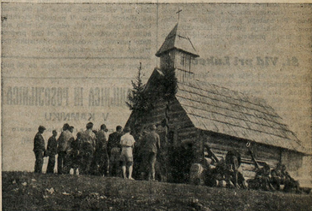
Lani se je v novi kapelici na Veliki planini darovala prvot sv. maša.

Kmalu bo tukaj 31. julij. Vse prijatelje Velike planine vabimo in opozarjamo že da-