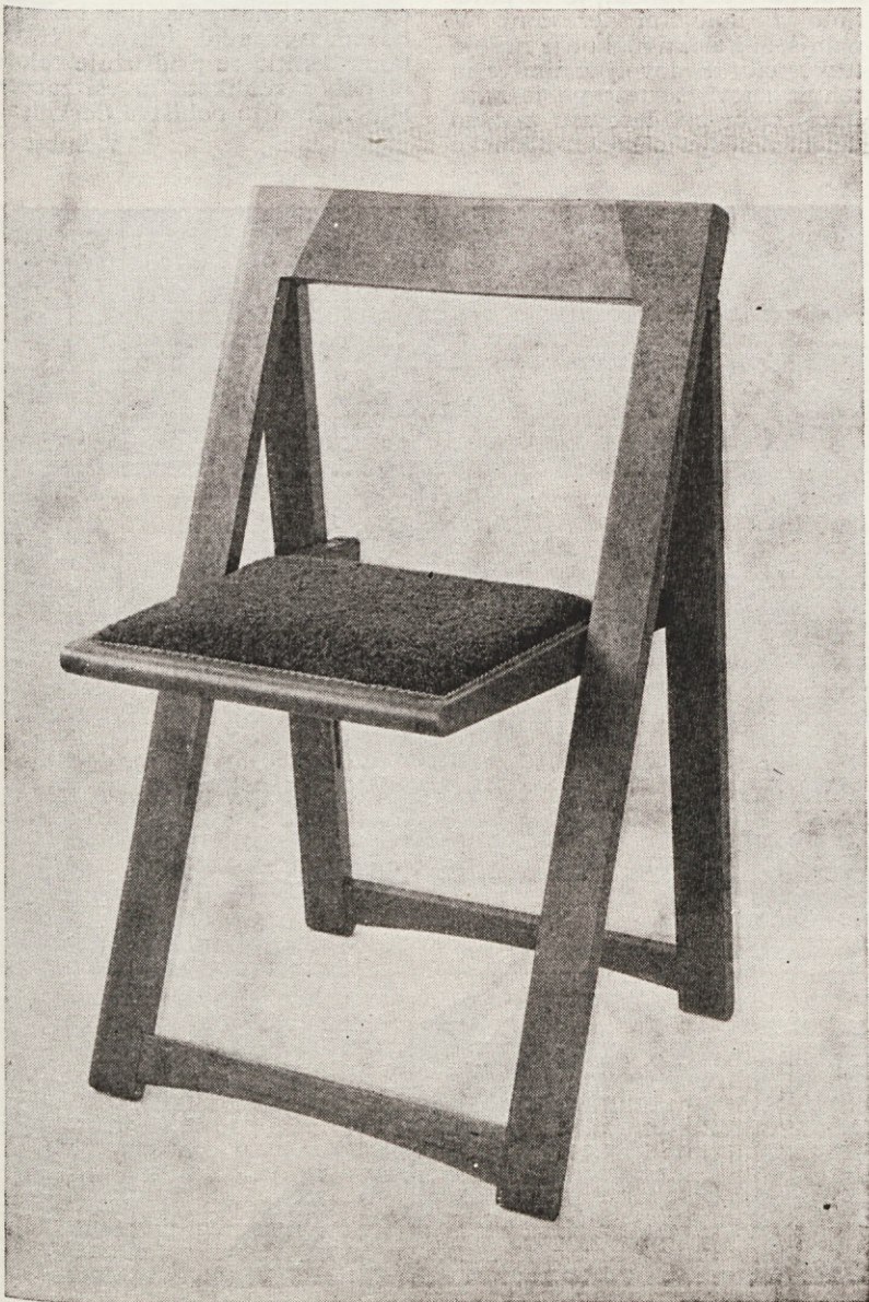
Oblazinjeni stol K-33, izdelek Tovarne lesnih izdelkov Stari trg