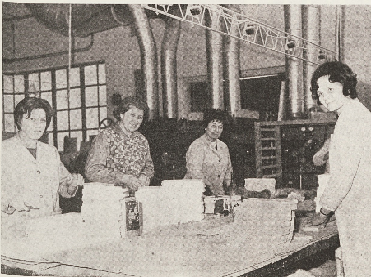
Ob 8. marcu čestitamo vsem ženam delovne skupnosti BRESTA