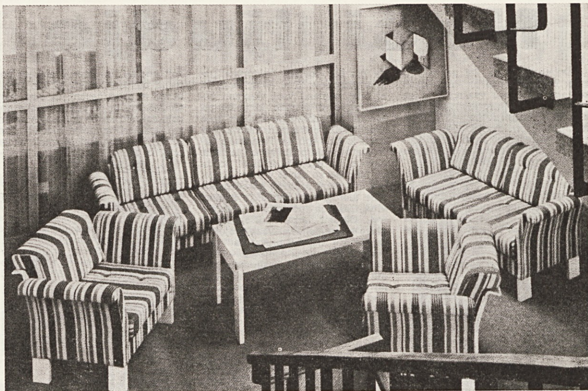
Sedežna garnitura »Eva« v posebnem ambientu