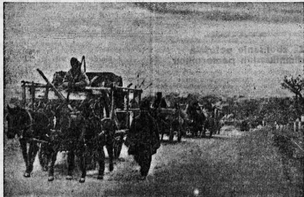
Še ena slika, ki kaže, kako so se selili Bolgari iz romunskega dela Dobrudže. Nove domove na bolgarskih tleh si je moralo poiskati 85.000 Bolgarov.

Takole je mislil Shaw o zdravnikih in njihovih nasvetih: »Kadar zbolim, vselej vprašam za svet najmanj pol ducata zdravnikov. Različnost zdravniških ugotovitev in navodil me prepriča, da še vedno najboljše storim, če se zdravim po svoji pameti.«