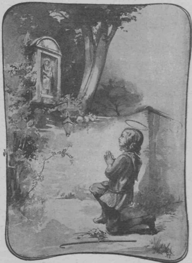
Blaženi Henrik Suzo.

Kraljica nadkriljuje v časti in vrednosti vse nebeške množice. Tudi sam začne peti in se pridruži nebeškemu