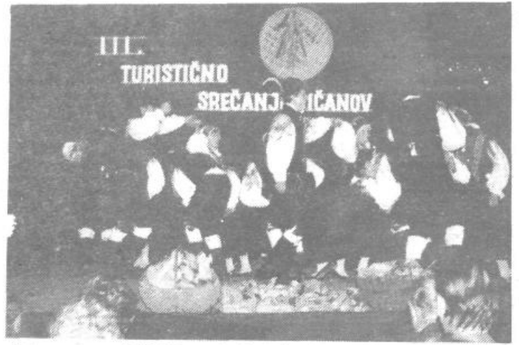
To leto smo povabili folklorno skupino iz Šentjošta. Bili so poskočni, navihani in napravili so resnično dobro razpoloženje