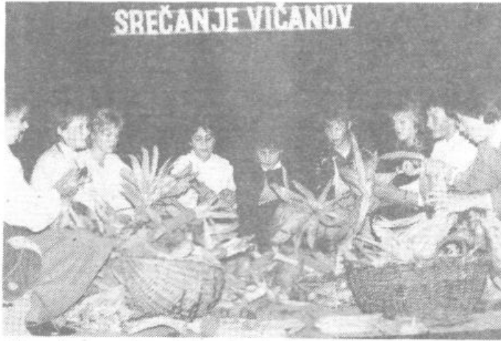
Iskovarci so ponosni na mlade pevke, zato si brez njih prireditve skorajda ne predstavljajo. Ob kvalitetnem prepevanju so nam prikazale tudi licanje koruze.