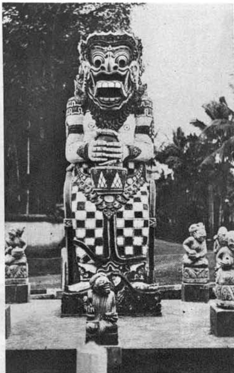
Ogromni kip smrtne demona pri mestu Tabanan na otoku Bali.

Velezanimivo nam opisuje življenje in razmere na teh daljnih otočjih potopis, ki ga je pred kratkim izdalo Ullsteinovo založništvo v Berlinu pod naslovom »Veseli dnevi z rjavimi ljudmi« (Heitere Tage mit braunen Menschen) in ki ga je napisal R. Katz. Pisatelj nam ne slika, kakor žal le premnogo potopiscev, svojih prihodov in odhodov iz hotelov, voženj po parnikih in železnicah, temveč nas vodi sredi mestnega vrvenja, za mizo oddaljenih farmarjev in lastnikov obširnih plantaž, k ognjiščem domačih Malajcev, skratka: križem tega bujnega tropičnega otočja, tako da so nam prebivalstvo, dežela sama in razmere nazorno pred očmi. Ena izmed prav dobrih knjig v današnji povodnji potopisne literature. Tudi naše štiri slike so vzete iz te knjige.