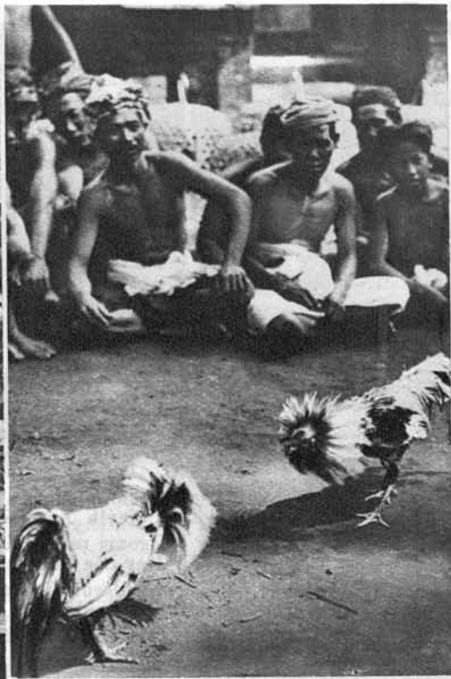
Zgoraj na desni: Petelinji dvoboj, najljubša zabava prebivalcev na otočju Južnega morja.