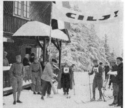
Vojak na startu.

Na levi: Dve Smrekarjevi karikaturi Finžgarja. Zgoraj: lovska idila. — Spodaj: ekonom na Robežu med vojno.