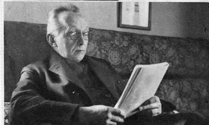
Popoldanski oddih. Na desni: V kotu svojega kvartirja.