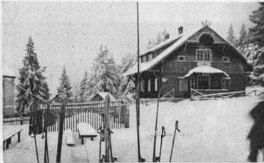
Planinka pod snegom.

Dne 11. jan. so se vršile pri Ruški koči tekme, katerih prireditelj je bil mariborski smučarski klub. Okoli 80 smučarjev se je zbralo pri koči, ki so z zanimanjem sledili plemeniti borbi mladih moči. V disciplini seniorjev je nastopila ekipa 5 članov smuškega odseka dij. inž. čete iz Maribora, kar je posebno ugodno vplivalo na udeležence. In če pomislimo, da so se kljub tolikim težavam, katere vsebuje vojaška služba, tako dobro plasirali, so nam s tem le še bolj dokazali svojo veliko sposobnost. Vojaška oblast pa je ponovno potrdila naše mnenje, da je in bo z vso vnemo uvajala v našo mlado armado lepo misel smučarstva.