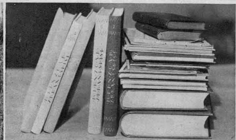
Nekaj Finžgarjevih del. Na levi: Na petelina.