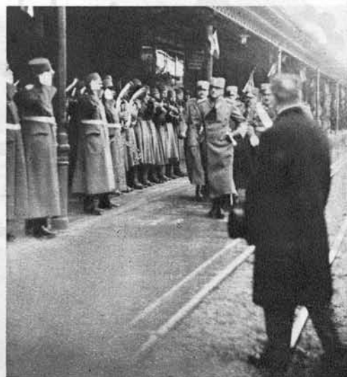
Kralj prihaja iz dvornega vlaka na peron zagrebskega kolodvora, kjer ga pričakujejo neštete deputacije.

Na levi: Nepregledne množice pričakujejo kralja pred zagrebskim kolodvorom.