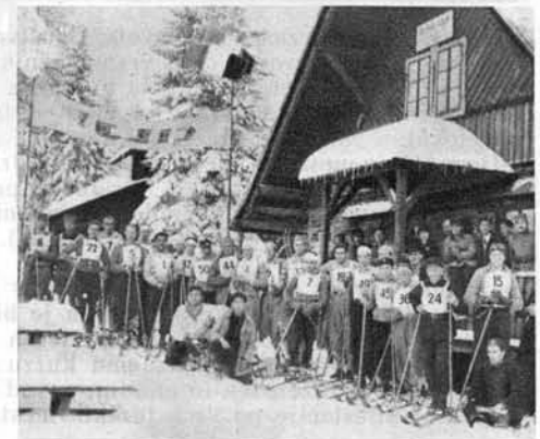
Tekmovalci pred Ruško kočo.