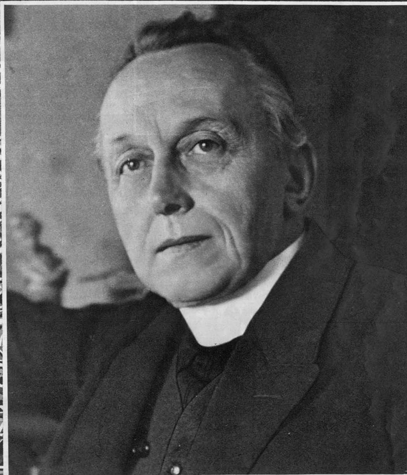
PISATELJ F. S. FINŽGAR — ŠESTDESETLETNIK