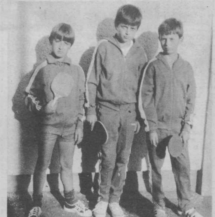
Trije od najboljših, ki zmagujejo na letošnjih tekmovanjih