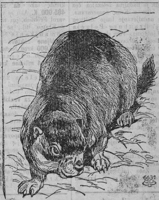
Das Bobak-Murmeltier, der Pestverbreiter in China.

Že v zadnji številki smo prinesli nekaj slik iz dežele, v kateri divja sedaj grozovita »črna smrt« ali kuga. Kakor povedano, so veliki deli Kitajske zdaj tej strašni bolezni podvrženi. Cela mesta izumirajo in na tisoče mrličev so že požgali ali pa v ledu zakopali. Obupanje, beda, trpljenje prizadetega ljudstva je naravnost nebovpijoče. Kogar prime kuga, tega vržejo sosedi brez usmiljenja na cesto, da ne bi bolezen nalezli. Glavni razširjevalec kuge pa je neka podgani podobna živalica z imenom »bobak« ali (po kitajsko) »tarpagan«. Pred kugo beži celo ta živalica in jo s tem vedno naprej razširja. »Bobak« je v nezmernih tamošnjih puščavah zelo razširjen. In vsled prenašanja kuge postaja ta mala žival največji sovražnik človeštva. Naša druga podoba kaže razne sličice iz od kuge prizadetih pokrajin. Zgoraj vidimo v mestu Karbini na cesti sedečega na kugi bolanega Kitajca. Prebivalci hiše so ga vrgli brez usmiljenja na cesto, da bi sebi zdravje ohranili. In tako pričakuje zdaj rešiteljico smrt! — Spodaj vidimo sanitetni voz, s katerim se bolnike in mrtve odvažajo in to na levi strani odprti voz, ki je gotov za odhod in poleg katerega stoji strežnik z zvezanimi ustri; na desni strani pa prihod sanitetnega voza pred okuženo hišo. — Grozne so žalostne, ki se odigravajo v