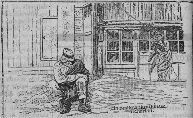
Ein pestkranker Chinese in Charbin.