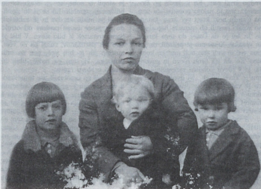
Lukančičeva mati z otroki, ko so pribežali pred fašisti v Slovenijo