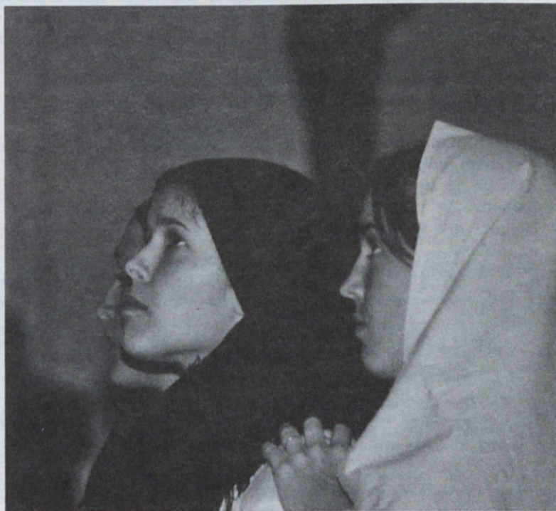
S pasijona, ki so ga igrali lani na cvetno nedeljo na Slovenski pristavi.