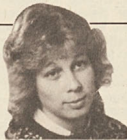
PIŠE HEIDI STINGLER

Prepričana pa sem, da bi ta mladinska organizacija zbudila pri kmetih mnogo manj navdušenja, če bi se ti zavedali, v kakšni meri finančno podpira Kmetijska zbornica delo te mladine. In to z denarjem, ki ga dobi od zveze in vlade za zastopstvo in podpiranje kmetov. Koliko kmetov, ki se dnevno bori za obstoj bi lahko podprla Kmetijska zbornica s tem denarjem, ki ga investira v takomenovano „Landju-