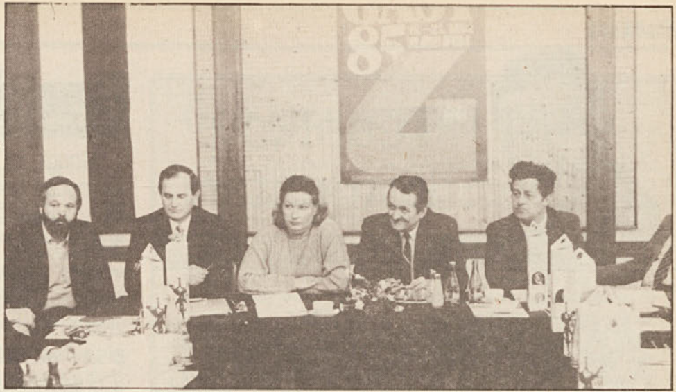
Sejem za turizem in gostinstvo „Gast 85“ je v četrtek, dne 21. 3. 1985, zapri svoja vrata. Zadnji dan je bil jugoslovanski dan. Več o tem na straneh 2 in 3.

Poštnina plačana v gotovini Celovec P.b.b. Erscheinungsort Klagenfurt Verlagspostamt 9020 Klagenfurt