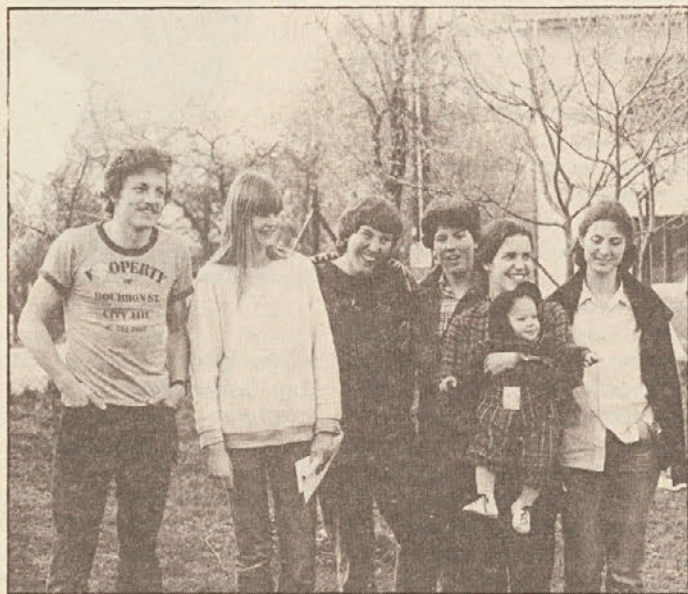
Koroški dnevi ob Veliki noči so postali že tradicija.

šnimi mladinskimi skupinami bodo imeli mladinci možnost neposredno doživeti slovenski kulturni prostor na Koroškem. Dana jim bo možnost spoznati slovensko narodno skupnost v njenem kulturnem, političnem, gospodarskem in verskem delu. Tako, da bodo lažje razumeli razne korake slovenske skupnosti.