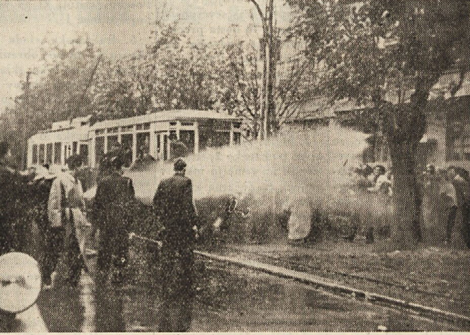
Jugoslovanski narodi so se lani odločno uprli diktatu od 8. oktobra, kljub temu pa je Tito letos 5. oktobra podpisal v Londonu sporazum, ki je v bistvu izvedba anglo-ameriške note. — Na sliki: Titova milica poliva beograjske demonstrante.

„MARSAL TITO, ki danes odbija sklep ZDA in Anglije, da se