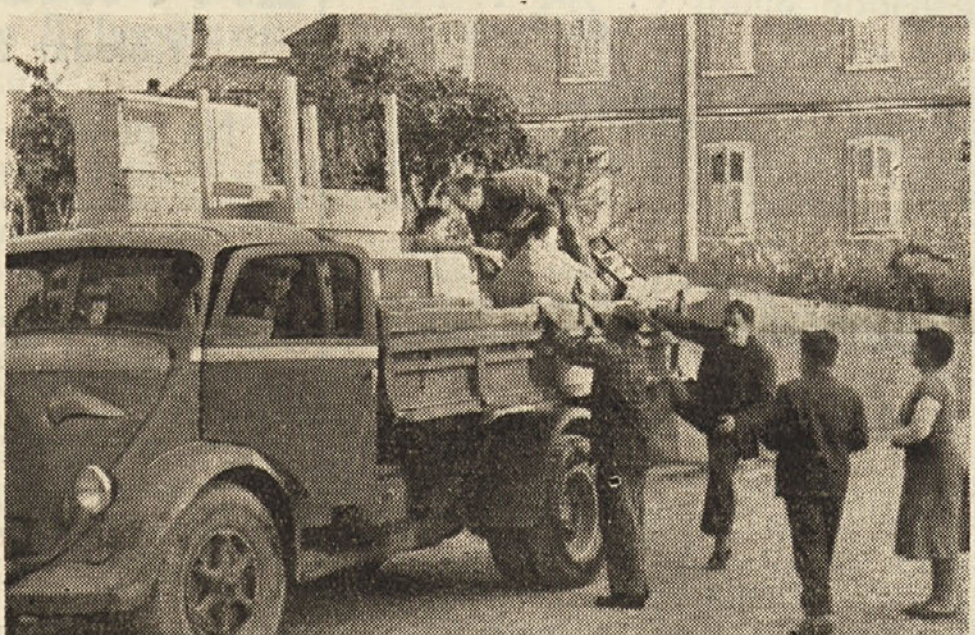
Se predno je bila dana v javnost uradna vest o podpisu razkazanja STO so v Hrvatinih začeli s pripravami za selitev. Slične prizore, kot nam ga kaže slika iz Hrvatinih, lahko vidimo na zalost te dni v vedno večjem številu po vseh vaseh miljskih hribov, ki so odrezane od svoje občine

nomo po delavcih, niso odgovorili na izsiljevanje nacionalizma. Večinoma so ostali brezbrizni. Pri Sv. Jakobu n. pr. je bilo izredno malo zastav, pač pa smo opazili na breže- vitnih oknih izredno dosti perila, kljub temu da je bilo v torek vreme kaj malo ugodno za sušenje. Seveda je tako za držanje ljudstva silno dražilo prenapetosti, zato so hodili iz- zivat po vseh predmetjih in tudi k Sv. Jakobu. Vendar pa ni prišlo do incidentov. Pobalinski manifestanti so se pove- činoma omejili le na posvke in živje. Seveda so bili naši za- vedni mesčani, zlasti pa delavci pripravljeni odgovoriti na morebitne provokacije.