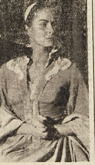
Filmska igralka Alida Valli je to dni nepričivano potrdila svoj telefonski razgovor z Giampierom Piccionijem

Moja vlada meni, da je jugoslovanska vlada s svoje strani pripravljena dovoljno proučiti vprašanje italijanskim kulturnim