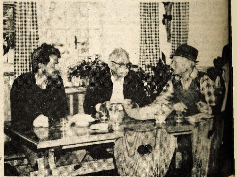
Zapisovanje pogovora pri Marencovcu nad Zalo.