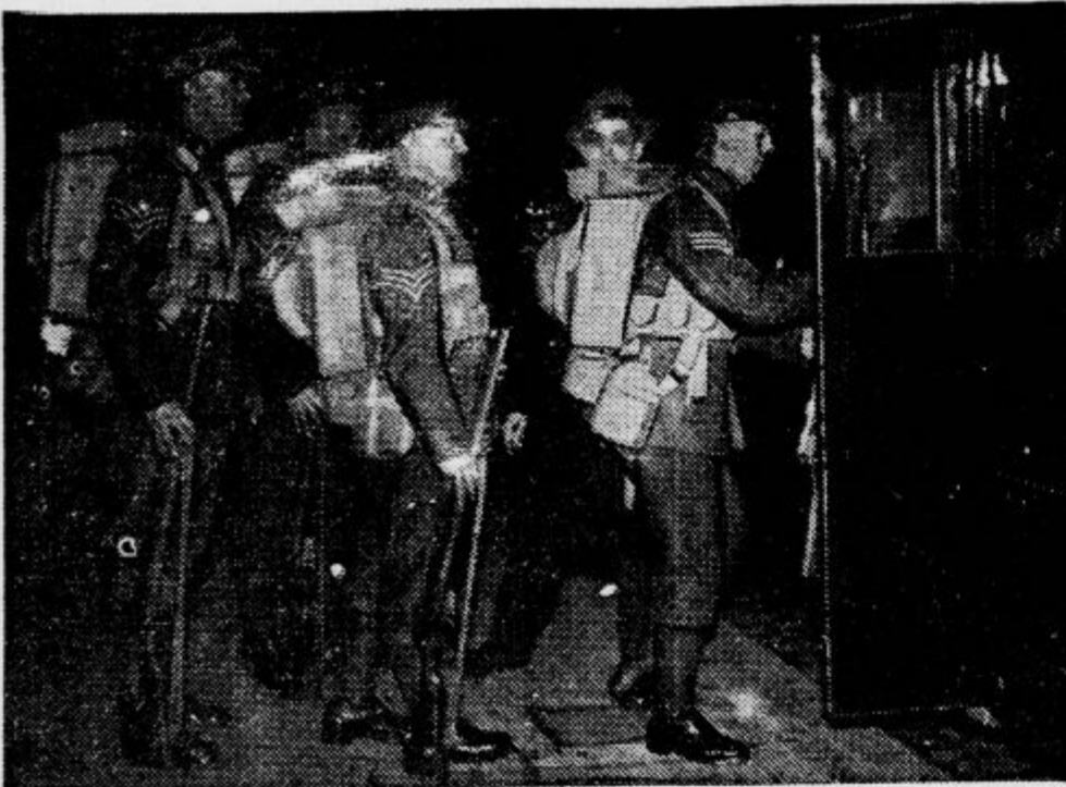
Angleški vojaški oddelki, ki so skrbeli za red in mir v plebiscitnem področju Posaarja, so te dni zapustili nemško ozemlje ter si na povratku domov ogledali nekatere pariške zanimivosti