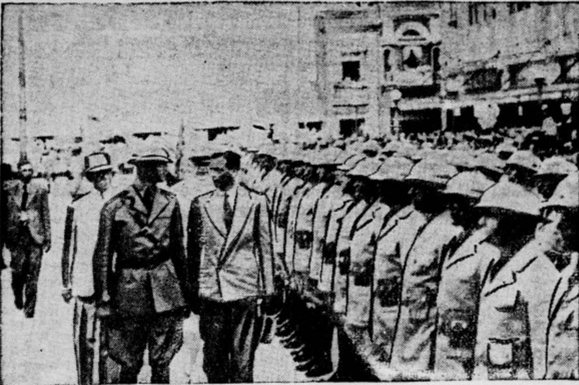
Kentski vojvoda in vojvodinja Marina sta na svojem poročnem potovanju prispela na Antile v Portorico, kjer je najmlajši sin angleškega kralja pregledal častno četo ameriških vojakov