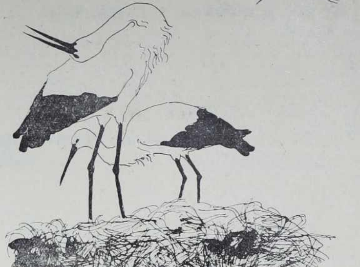
Storklje, štoklje...; v ravninah ob levem bregu Mure dobre znanke. Najraje gnezdijo na dimnikih starejših zgradb

Lepa doživetja nam je ob takih razmišljanjih nudil ta čas v Prekmurju: prostrana polja s številnimi križi rži in pšenice, ki so se sušili na vročem soncu, nato visoko naloženi vozovi s kravjo vprego, ki so vozili še pozno v večerni mrak po prašni cesti skozi vasi na dvorišča, kjer pod gumlom in šatori čaka žito na »mašini«, saj so »sepe« že zdavnaj izginile iz uporabe in se ohranile le tam, kjer čaka slamnata streha na novo ritovino. In na koncu mlatič! Koliko dinamike je v prizorih, ki jih nudi v teh dneh sleherno dvorišče, ko mlatilnica udarja enakomeren takt in ko se v vreče siplje zlata