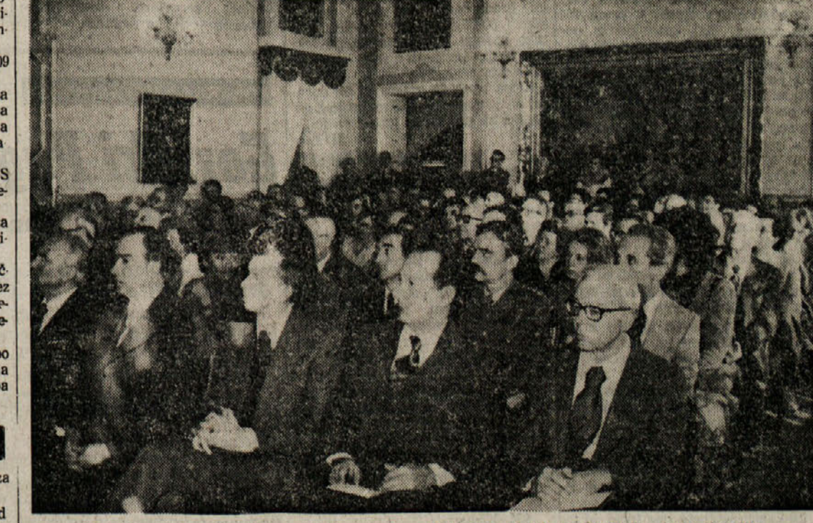
Pogled na Attemsovo dvorano med razpravo o delovanju glotologa Graziadisa Isaia Ascollja