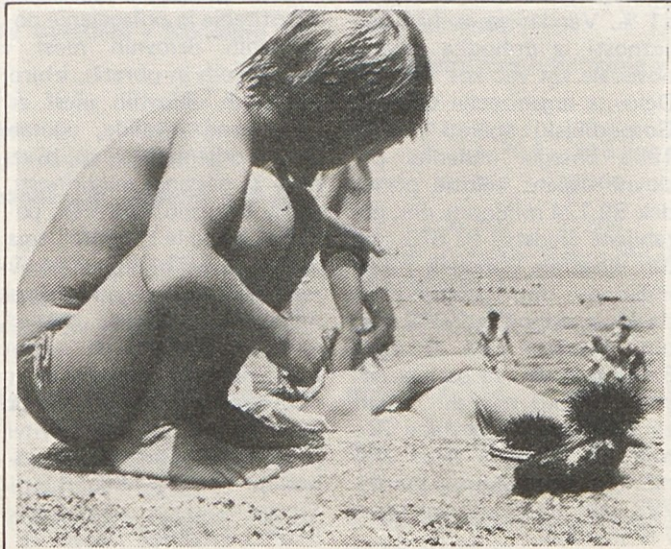
Kam na letni oddih – preberite na strani 3,4 in 5!

ganizacijski strukturi delovne skupnosti skupnih služb Gorenja SOZD in ocenili izvajanje integralnega projekta Obnove Gorenja in se seznanili s predlogom Programa preobrazbe Gorenja SOZD. Pregledali pa bodo tudi svoje delo ter sprejeli program dela delavskega sveta Gorenja SOZD za letošnje leto.