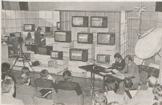
Gorenje je v Radencih predstavilo Gorenjev sistem za obveščanje gostov v turističnih objektih. Več na 2. strani.

List za obveščanje delavcev gorenje Gospodinjski aparati Notranja oprema Procesna oprema Elektronika Široka potrošnja Commerce Servis Raziskave in razvoj Interna banka DSSS Gorenje SOZD DS Splošni posli DS Informatika in organizacija