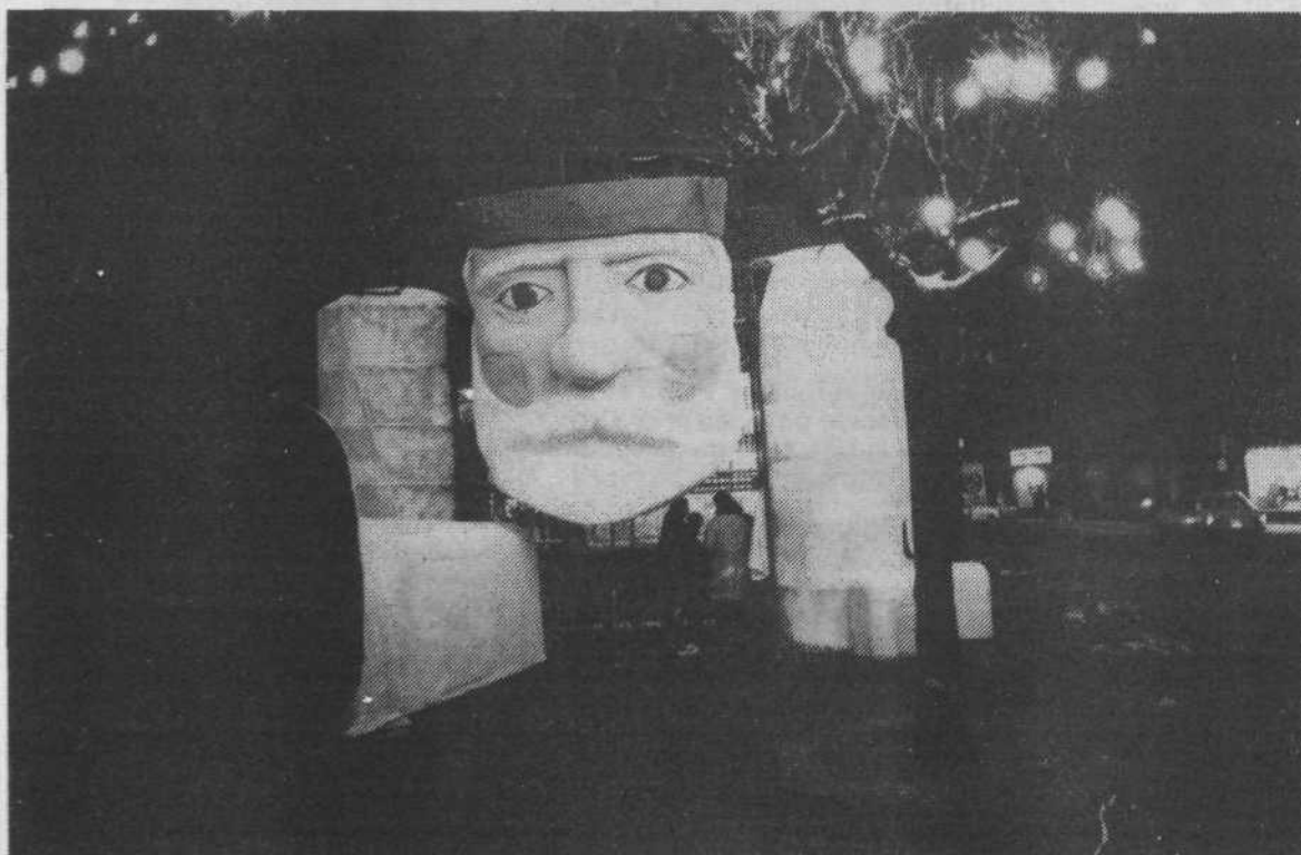
Velik dedek Mraz pred Tromostovjem vzbuja pozornost in razveseljuje staro in mlado