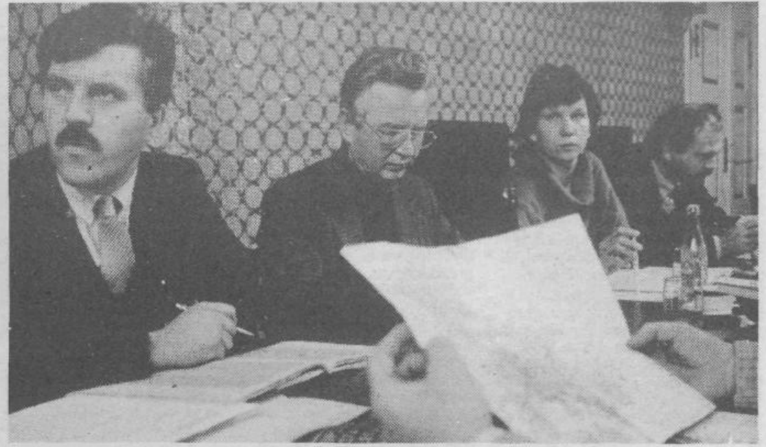
Pogovor o tem, kako inovacijski dejavnosti dati mesto in pomen, ki ji pripada