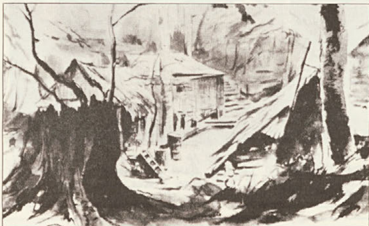
Božidar Jakac: Jelendol (tuš, 1944)