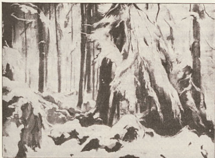
Božidar Jakac: Na Bazi 20 (pastel, januarja 1944)