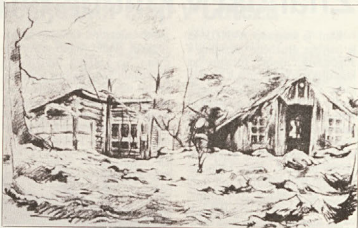
Božidar Jakac: partizanska bolnišnica Zgornji Hrastnik (rdeča kreda, 1944)