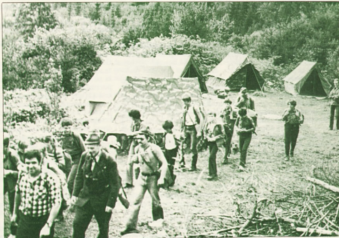
Iz Podstenic proti vrhu Roga — prizorček z lanskega tridnevnega pohoda dolerjskih tabornikov, ki so v spremstvu gozdarjev in lovca spoznavali lepote največjega kompleksa naše pokrajine.

Po seji organov upravljanja in uvedbi racionalnejše organizacije dela je odšlo 29 delavcev skupnih služb te delovne organizacije na delo v neposredno proizvodnjo.