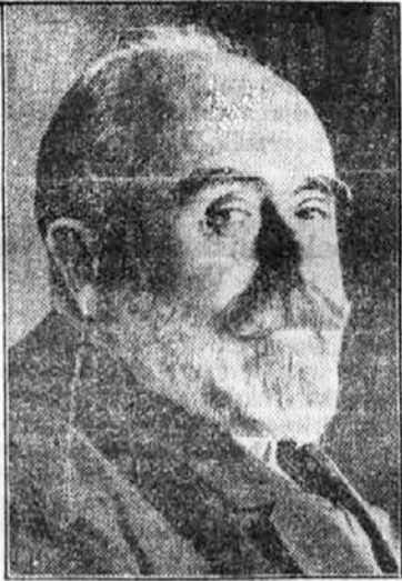
La Cierva, prometni minister v novi španski vladi