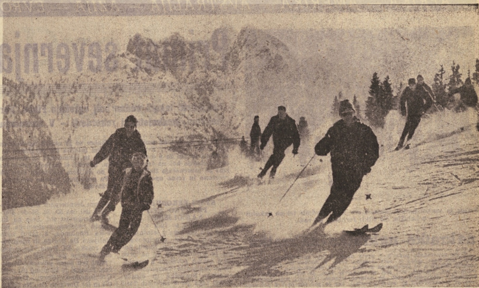
Takih mladih smučarjev, ki skoraj do popolnosti obvladajo smučl, je že kar precej. Smučarski trenerji pozor!

Začetniki se nauče smučanja v 1 tednu. Odlikuje jih velika vztrajnost in dobra oprema, najbrž drži trditev, da toliko smučarjev še ni bilo na smuških terenih v Sloveniji