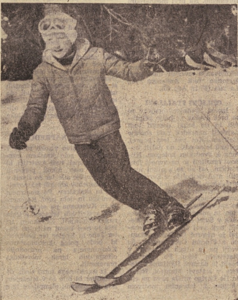
Tale smučar, star komaj 11 let, drvi po strmih terenih Vitranc brez kakršnegakoli strahu in težav

Po vsem skupaj sodeč, bi lahko prav po razpoloženju mladine, po vsem tistem, kar danes lahko opazimo na naj- različnejših terenih ugotovili, da naš ljudski šport — smučanje ni v krizi. Prav nasprotno. Osnova, zares množična osnova je večja kot kdajkoli prej! Tehnična oprema te množične osno- ve je boljša kot kdajkoli prej! Tehnično znanje vse te množice smučarjev je boljše kot kdaj- koli prej...! Z drugimi besedami, treba je tistih pridnih in močnih rok, ki bi vse te mlade smučarje usmerile v društva in klube, jih izpopolnile in naučile tekmovalnih fines in tako nare- dila slovenskemu in jugoslo- vanskemu smučarstvu nepre- cenljivo uslugo.