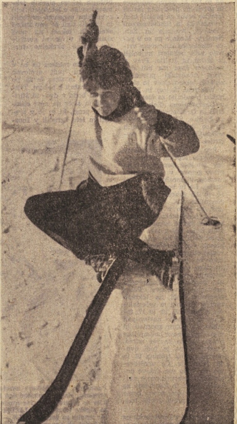
Tudi brez padcev ne gre...

imajo več vzdržljivosti (in tudi več denarja), si privoščijo celo 15 ali 16 km vožnje na dan. To pa je seveda tako veliko, da je uspeh ob zaključku tečaja za- gotovljen. Ko smo obiskali tečaj Tehnične srednje šole so nam povedali, da so njihovi smučar- ji »zapravili« v enem tednu na