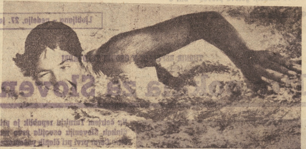
Dawn Fraser je prva ženska, ki je premagala »magično« minuto in preplavala 100 m prosto v času 59,6.

V obeh štafetah beležimo v pretekli sezoni nove svetovne rekorde. Najprej so Nemke na evropskem prvenstvu v Leipzigu izboljšale rekord v mešanem slogu. Avstranke pa so proti koncu leta izboljšale rekord še v disciplini 4 x 100 m prosto, zahvaljujoč se predvsem rekorderki Fraserjevi, ki je k temu rekordu pripomogla levji delež.