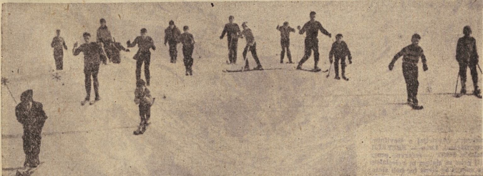
V Gorjah so tudi mnogi mladi gostje iz Ljubljane in drugih krajev. Seveda prebijejo ves dan na prijetnih smučiščih.