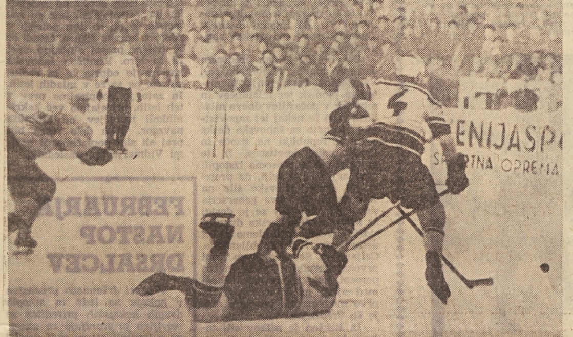
Sestaviti državno reprezentanco je težko! Se težje pa je vprašanje priučiti moštvo vse tehnične in taktične zamisli. Za takšne odgovorne naloge je v drugih športnih panogah več ljudi. Zakaj ne bi bilo tega tudi v hokeju?

MURSKA SOBOTA Nogomet — Na občnem zboru nogometne Radgone so ugotovili, da so ti dosegli lepe uspehe v laniški tekmovalni sezoni, ko so osvojili prvo mesto v Pomurski nogometni ligi, da pa je bil njihov start v jesenskem delu Mariborsko-murkosloboške nogometne lige precej slabši, kot so pričakovali. Na njihovo uvrstitev je prav gotovo vplivalo tudi to, da so morali večinoma tekem odigrati na tujem terenu, ker so svoje igrišče prav v času tekmovalja izgubili, ugotovili pa so tudi to, da bi z resnejšo