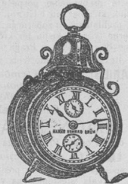
Budilnica z zvoncem

z ogledalom, 30 cm visoka s upravo za buditi 3'20 fl.; s kazalnikom, ki se po noči sveti 3'50 fl. Zvoni p av. glasno, da je človek ne more preslišati.