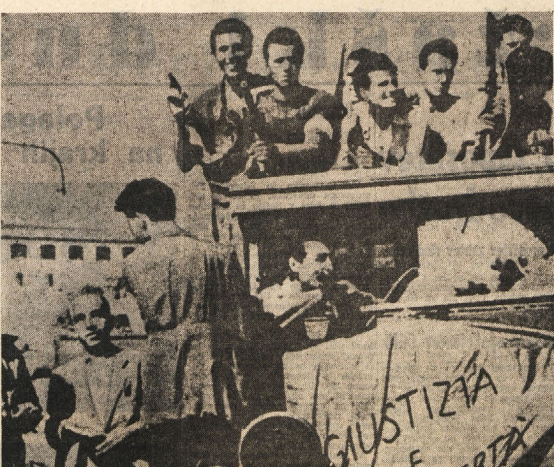
Leta 1945 na današnji dan je italijanski narod vstal za zadnji udarec proti tujemu okupatorju in do-mačnim fašistom. Partizanskim brigadami, ki so vdrle v mesta, se je pridružilo ljudstvo, tako da so za-vezniške emote prihajale v že osvobojena mesta severne Italije.