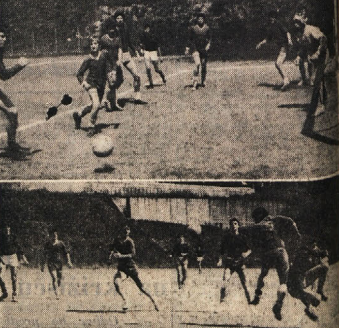
Nogometna tekma med enajstericama slovenske klasične in nove gimnazije v Trstu je potrdila, da se zanimanje za šport med našimi dijaki vedno večja. Govori se, da se bodo v kratkem gimnaziji obeh zavodov z združeno ekipo pomerili tudi z dijaki iz druge gimnazije.