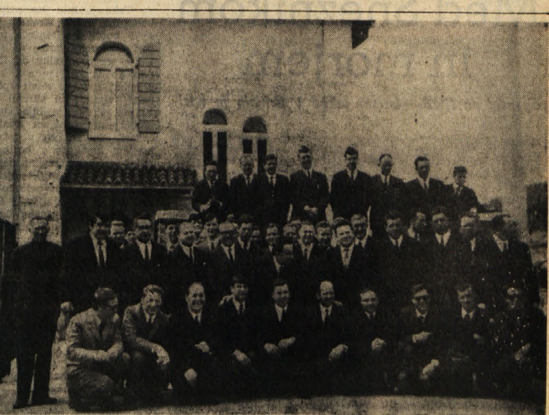
Na sliki je moški pevski zbor «Potela» iz Savinjske doline, ki je na vabilu p. d. «Jezero» uspešno nastopil predeljo v Doberdoba