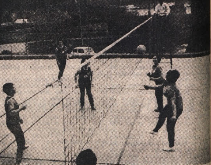
Prvenstvo v ženski odbojškarski B ligi je v preteklem tednu prineslo eno največjih presenečenj v tej sezoni. Mladi ekipi Breg je uspelo povsem nepričakovano premagati šesterko Brega, ki se je do pred kratkim potegovala za pravico do sodelovanja na kvalifikacijskem turnirju za vstop v A ligo. Na sliki prizor s tekmo med obema šesterkami.