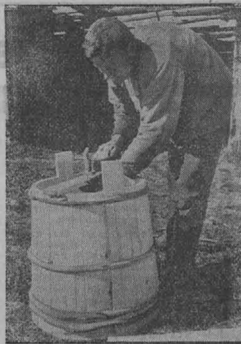
V zasednem vzhodnem ozemlju Ruski sodar napravlja čebre, ki jih potrebuje nemška oborožena sila v večjem obsegu za hrambo in prevoz.