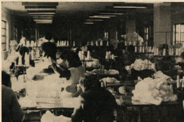
Obrat v Mirni peči. Preusmeritev proizvodnje iz pletilstva v konfekcioniranje daje tudi drugačen pogled v delovne prostore

Strojni park v šivalnici je dokaj izpopolnjen. Imamo 12 povsem novih in kvalitetnih strojev, ki so prilagojeni za specialne delovne postopke, kar nam omogoča kvalitetnejšo izdelavo raznih modelov. To je predvsem opazno pri izdelavi ženskih hlačk, kajti struktura in oblika le-teh je precej zahtevna z ozirom na močno konkurenco tovrstnih izdelkov. Zato je nujno zmanjšati, oziroma doseči najmanjše izdelavne stroške in prvovrstno kvaliteto. To lahko označimo kot osnovne delovne naloge obrata. Priznati moramo, da naloga ni povsem lahka, saj se celotni kolektiv srečuje z novo vrsto proizvodnje (pretežni del delovne sile je še na priučevanju v priučitveni dobi), kar vpliva na stopnjo delovnih učinkov in delovno kvaliteto.