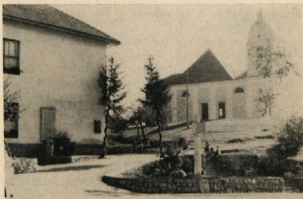
Na tem kraju v Suhorju pri Metliki so se v noči od 25. na 26. november bili boji med slovenskimi in hrvaškimi partizani ter belogardisti in okupatorjem. Partizani so uničili postojanko ter s tem tudi razvoj belogardizma na področju Bele krajine

Napad se je začel v večernih urah. Belogardisti so bili sicer presenečeni, vendar so se hitro znašli in dajali precej žilav odpor. Partizani so neprestano vedno bolj pritiskali in zoževali obroč okrog postojanke. Cankarjevci so dobro branili dostope sovražniku, da napadeni postojanki niso mogli pomagati. Partizani so s stalnim ognjem in z zažigalnimi napravami belogardistom do kraja strli moralo in jih prisilili v obup in predajo. Fašisti in belogardisti so se začeli predajati. Ob jutranjem svitu je bila postojanka v rokah naših borec.