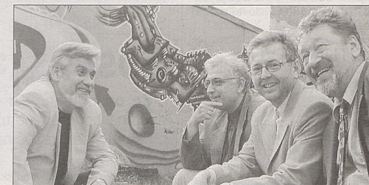
New Swing Quartet bo v nedeljo, 27. aprila, nastopil v Kotmari vasi.