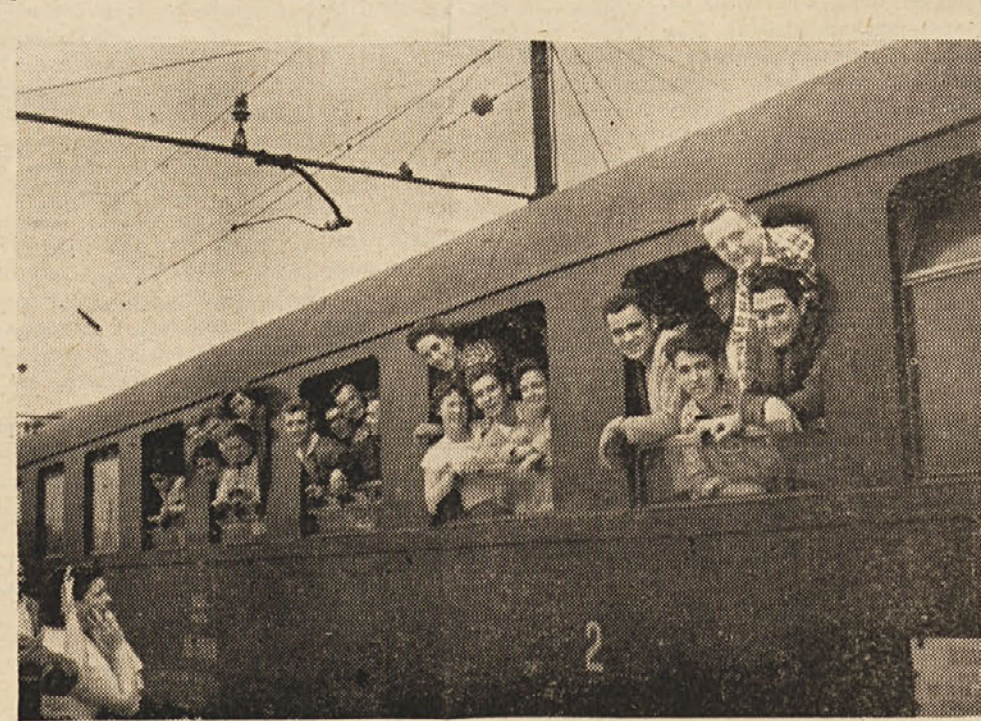
V torek je odpotovala iz Trsta delegacija, sestavljena iz 25 mladincev in mladink, Slovencev in Italijanov...