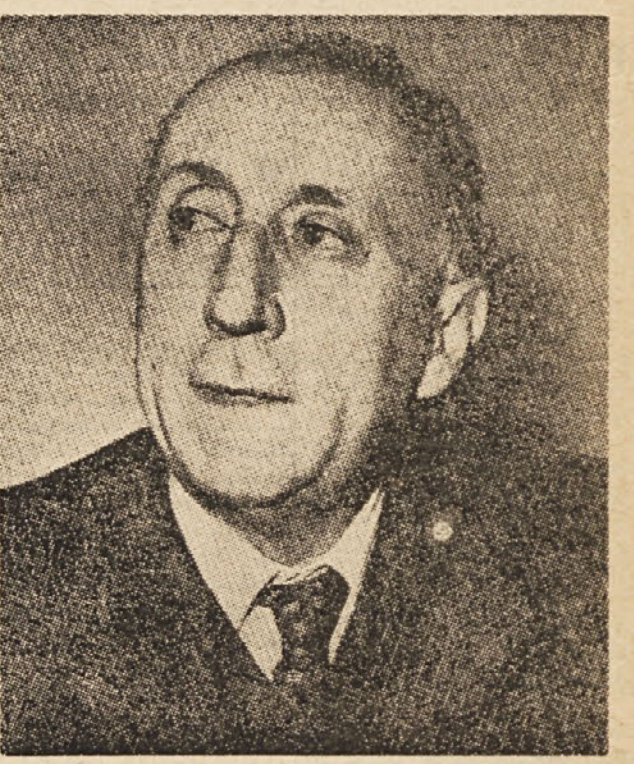
Senator Antonio Banfi, ki je v ponedeljek umrl v Milanu. Njegovo ime ni Slovenem neznan, saj si je že pred leti, kot član VI. senatne komisije, prizadeval za usakoniitev slovenskega solstva v Italiji.

obrambo sole in član VI. senat- ne komisije, ki se ukvarja prav s solskimi problemi. Bil je tudi predsednik Združenja Italija- Sovjetska zveza. Leta 1948 je bil izvoljen za senatorja v okrožju Abbiate- grasso s 42.654 preferenčnimi glasovi, leta 1953 pa v okrožju Cremona s 29.193 preferenčnimi glasovi. CK KPI je v zvezi z Banfijevim smrtjo objavil posebno poročilo, v katerem prikazuje lik ve- likega pokojnika, ki posebej naplemeniteje in najvzvis- nejše vrline kulturnega človeka, filozofa, učitelja, borca za svobodo in doslednega revolucionar- ja, čigar delež pri izgradnji italijanske demokracije in kul- ture je neprecenljiv.