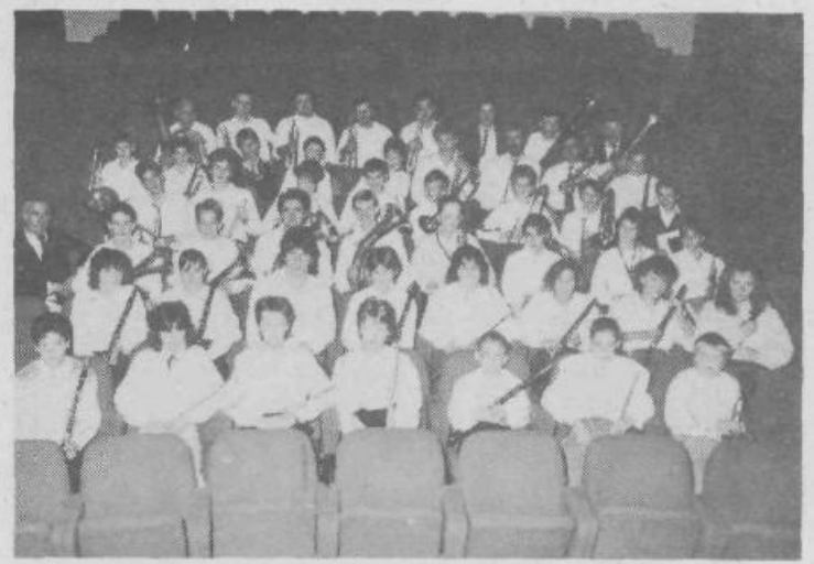
Člani pihalnega orkestra so se že v prvem letu delovanja uspešno predstavili na javnih nastopih