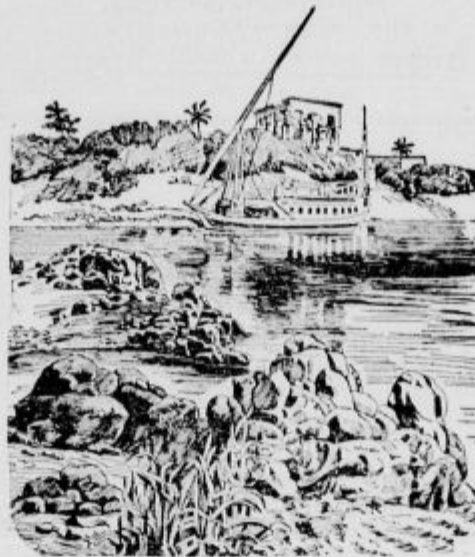
Kje je Arabec?