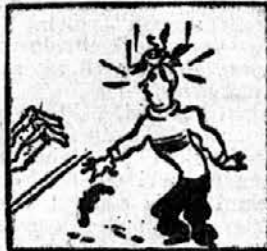
Nezgod pri startnem strelu.