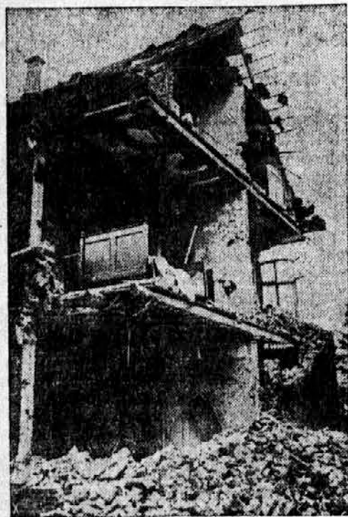
Učinek angleškega bombardiranja na neko mesto v zahodni Nemčiji

merjal živčevje s to boleznijo zadetih ljudi s telefonskimi žicami, ki so spojene na napačni spoj. Živci takih ljudi so spojeni v možganih na napačne možganske zavoje. Radi tega taki nesrečniki jočejo, ko bi se morali smejati in se smeji, ko bi morali jokati. Sicer pa sodijo zdravniki, da je na vsem svetu takih nesrečnikov prav malo.