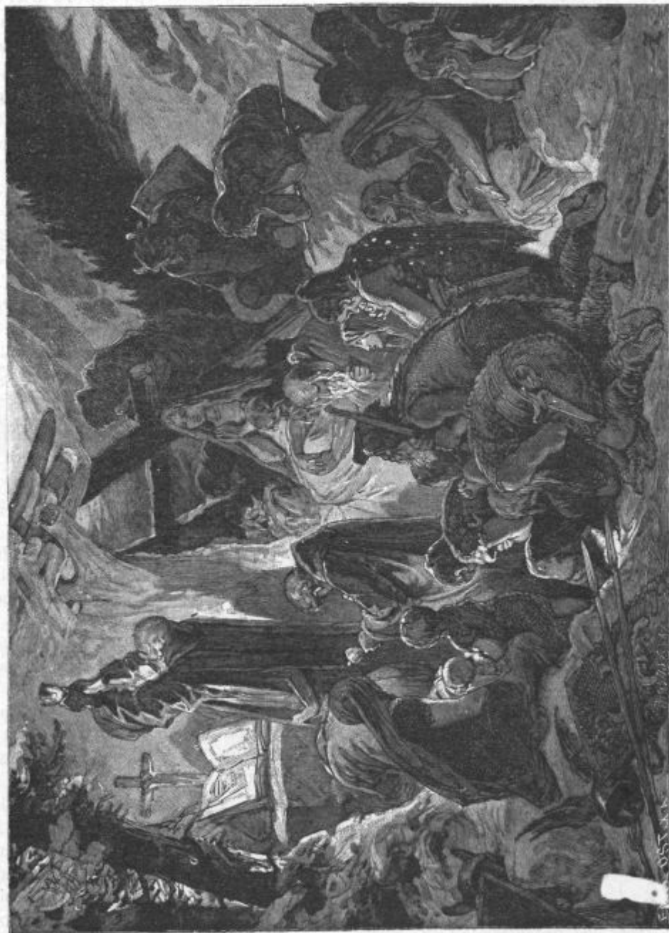
Naši predniki pri prvi sv. daritvi.

zmota pa je mnogotera. Ravno ta različnost ver in verskih ločin, ta silna razkosanost nam kaže, kam pride kratki človeški um, če je prepuščen sam sebi ali če se opira le sam naše. Le mi katoličani se ne moremo zmotiti, ker