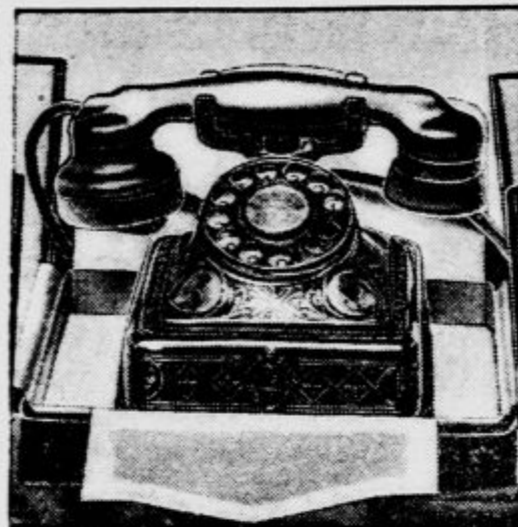
Telefonska priprava, bogato z zlatom okrasena, ki jo je papežu podarila ameriška brzajavna in telefonska družba.