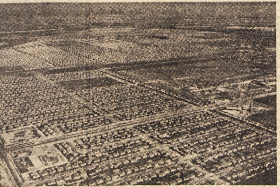
Uganili ste že, da gre za ameriško mesto, kajti v naši stari Evropi je še premalo sredstev, da bi mogli porušiti vse stare hiše

Za nekatere člane ameriške antarktične odprave — imenuje se «Deep Freeze» — so morali pripraviti kaj svojevrstna uspavalna sredstva. V ameriških mestih so posneli na magnetofonski trak hrup dnevnega prometa z vsemi možnimi trobentami, drdranjem, zvonovi itd. Člani odprave so po nekaj dneh bivanja v takih rituži svečne tišine niso mogli zaspati, ker so pogrešali običajni mestni hrup.