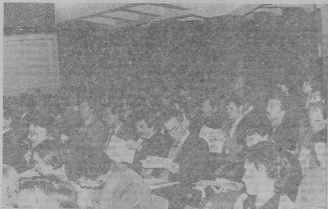
Delegati so zavzeto sodelovali na programski konferenci