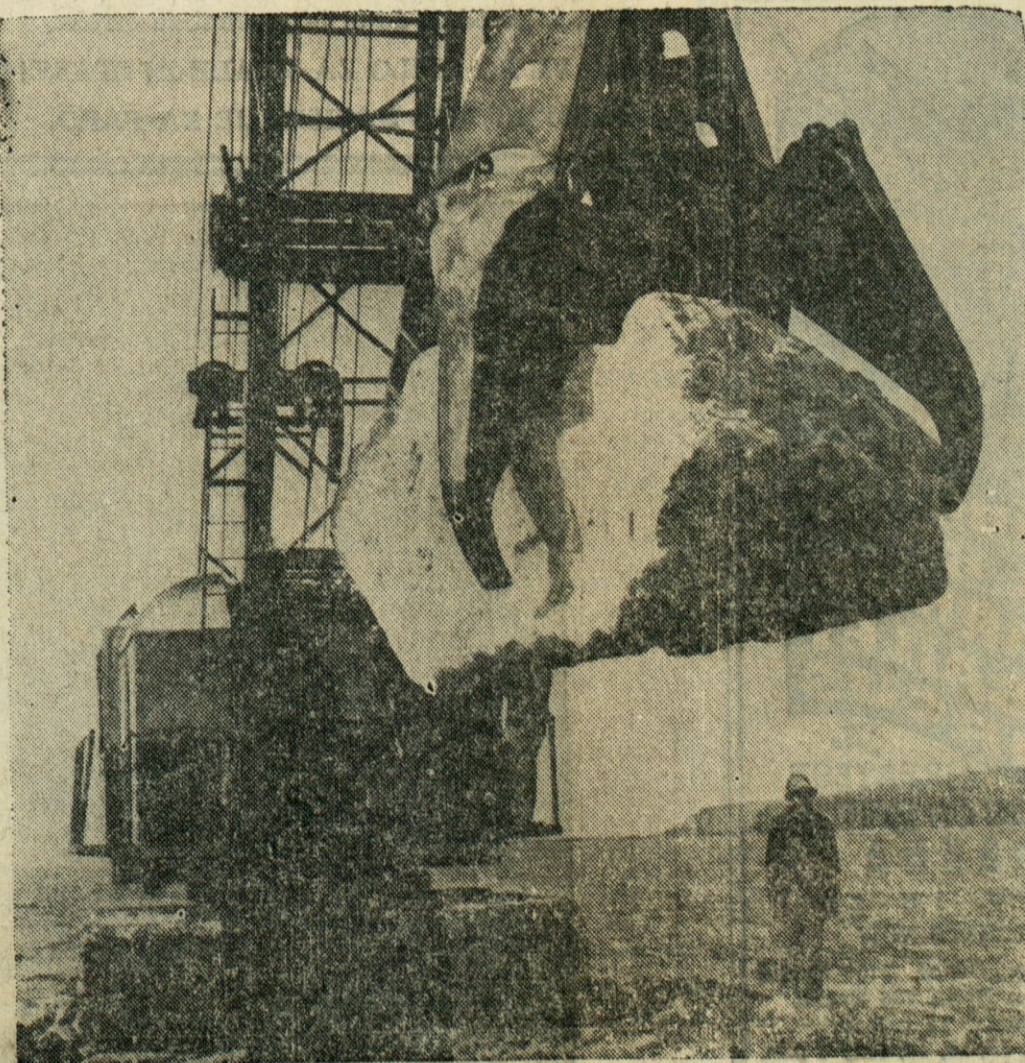
KAJ ČE ROKA POPUSTI? — Roka žerjava drži veliko skalo in po sliki sodeč je delavec v ozadju v življenjski nevarnosti. V resnici je on precej daleč proč in skala v nobenem slučaju ne more pasti nanj. Slika je bila posneta v bližini San Francisco, kjer grade nov valobran. Žerjav polaga v morje okoli 15 ton težke kamenite bloke.

6113 St. Clair Ave. — EX 1-8787 Cleveland 3, Ohio