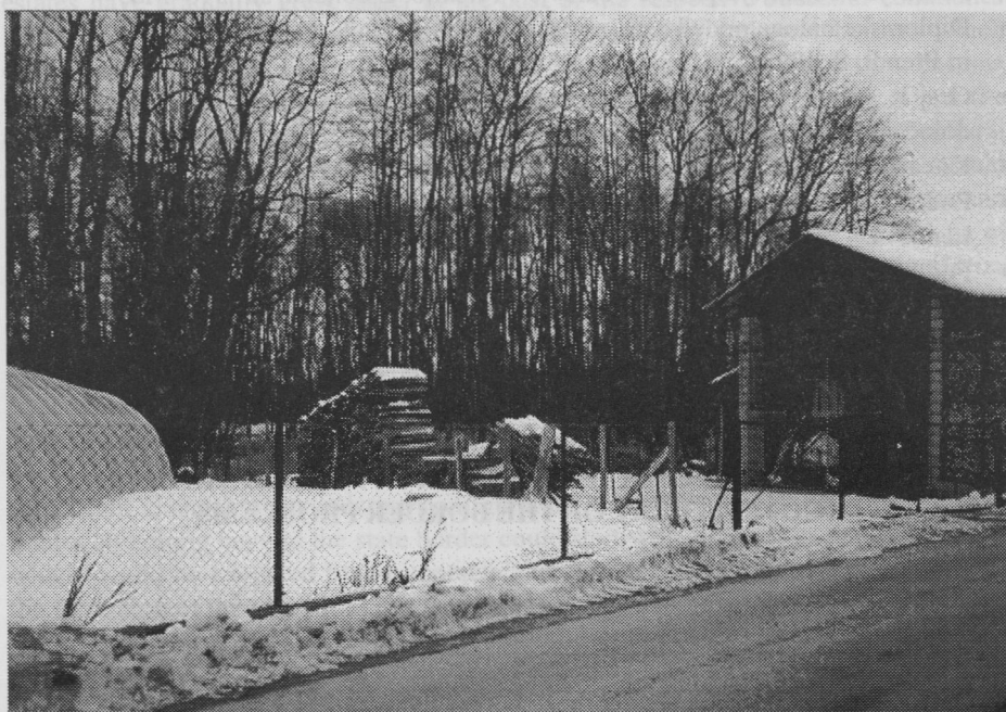
Slika 2: Meja tik ob naselju Hotiza

Zemljo na Hrvaškem ima 225 lastnikov, med njimi nekateri vinograde v Medjimurskih goricah, hrvaških lastnikov v k.o. Hotiza pa je komaj 7 s skupaj 0.8 ha zemlje (Prendl, 1993). Muro so na tem odseku regulirali in zemljišča z obrambnimi nasipi zaščitili pred poplavami. Na njem leži pet hišnih številk Hotize (zaselek Brezovec) s slovenskim življem, čez pa vodi dostop do broda, ki povezuje naselje z Martinom na Muri. Tu je razen tega locirana betonarna in v sosednji Kapci nogometno igrišče. Prav ti primeri sodijo v sklop aktualne obmejne problematike, ki zahtevajo življenjski pristop pri njihovem razreševanju (sl.2).