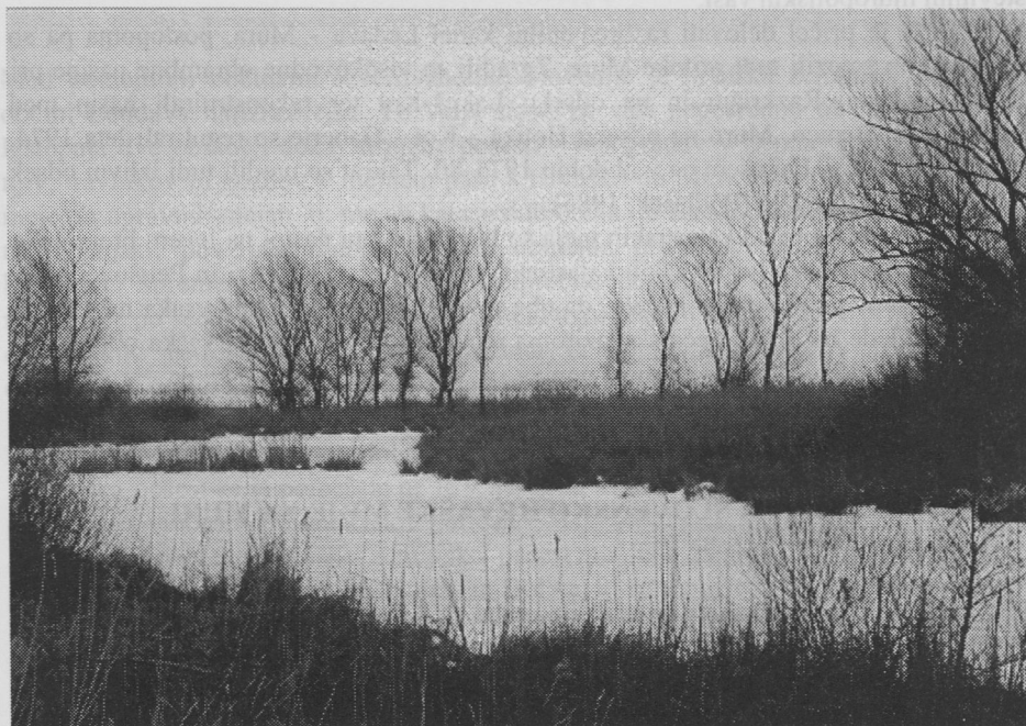
Slika1: Meja na starem meandru pri Petišovcih