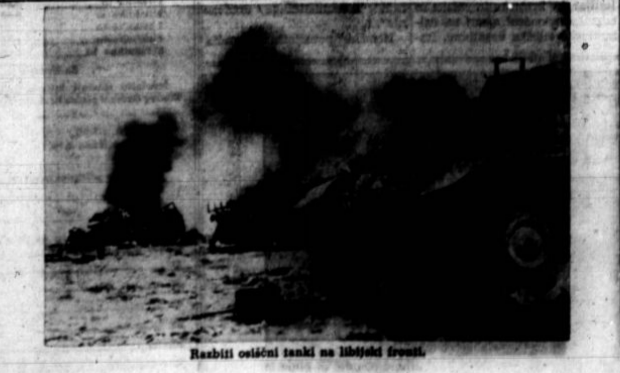
Razbiti ostični tanki na libijski fronti.

Manjkanje olja v Evropi. V Jugoslaviji ni prometa Bern, 30. jan. (NYT) — Poleg manjkanja živeža v Evropi je največja stiska za olje električno. Pokrajina za po- lno občuti. Navzlic nje- obsejnim gozdovom je se- Jugoslavija na vrsti. Poročila iz Beograda pravijo, da tam zaradi pomanjkanja