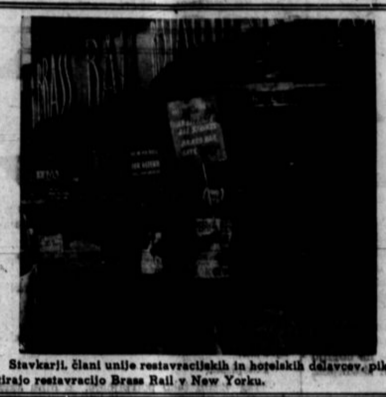
Stavkarji. Člani unije restavracijskih in hotelskih delavcev, pika- tirajo restavracijo Brass Rail v New Yorku.

Ze prej smo poročali po izviri- nih vesteh, ki smo jih prejeli, da so Pavelčević "vstali" pozaj- pri malone vse Hrvate in Slo- vence iz Julijske Krajine, ki so ostali v "neodvisni"; nekatere so